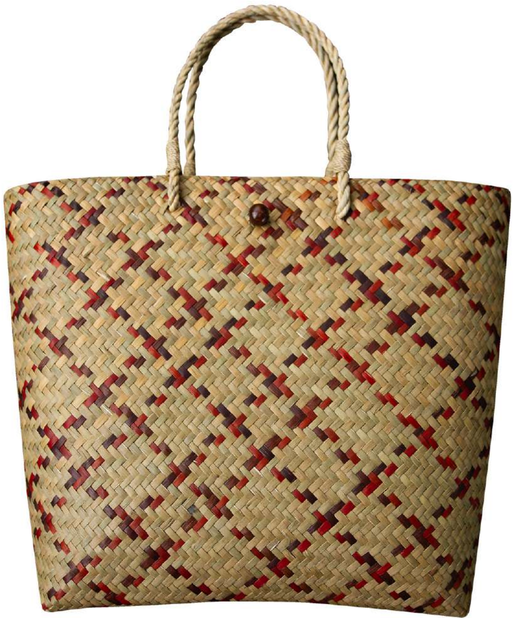
กระเป๋าจักสานกระจูด