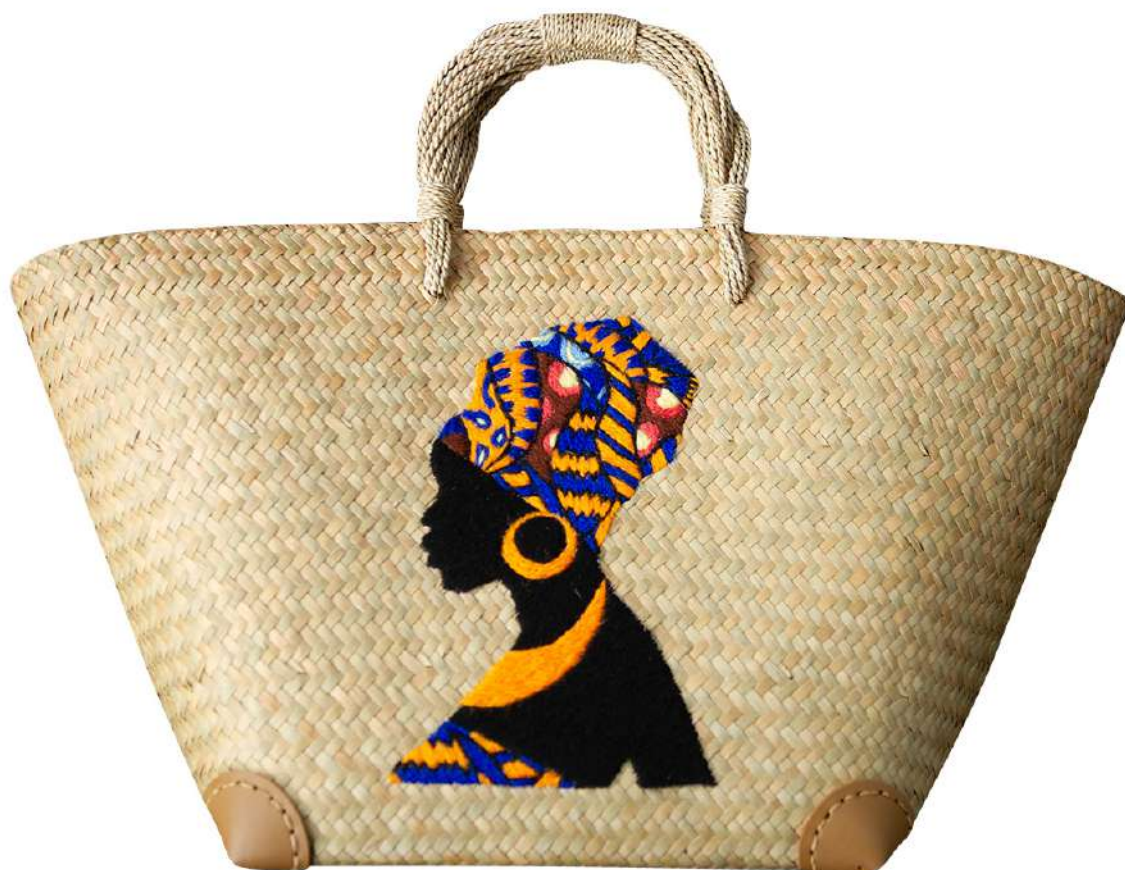
กระเป๋าจักสานกระจุต