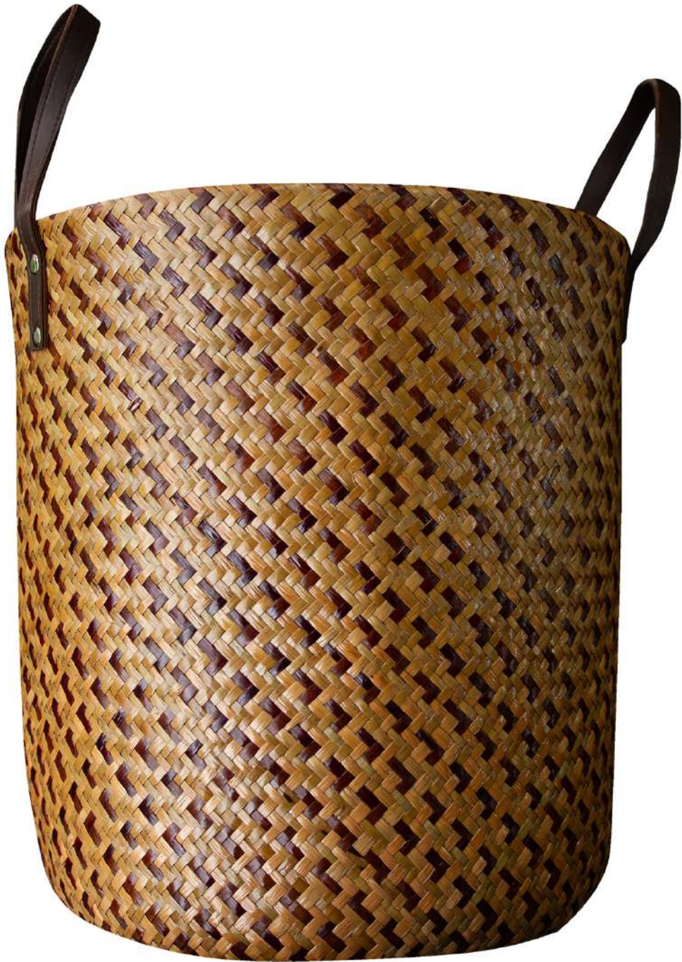
ตะกร้าจักสานกระจุด