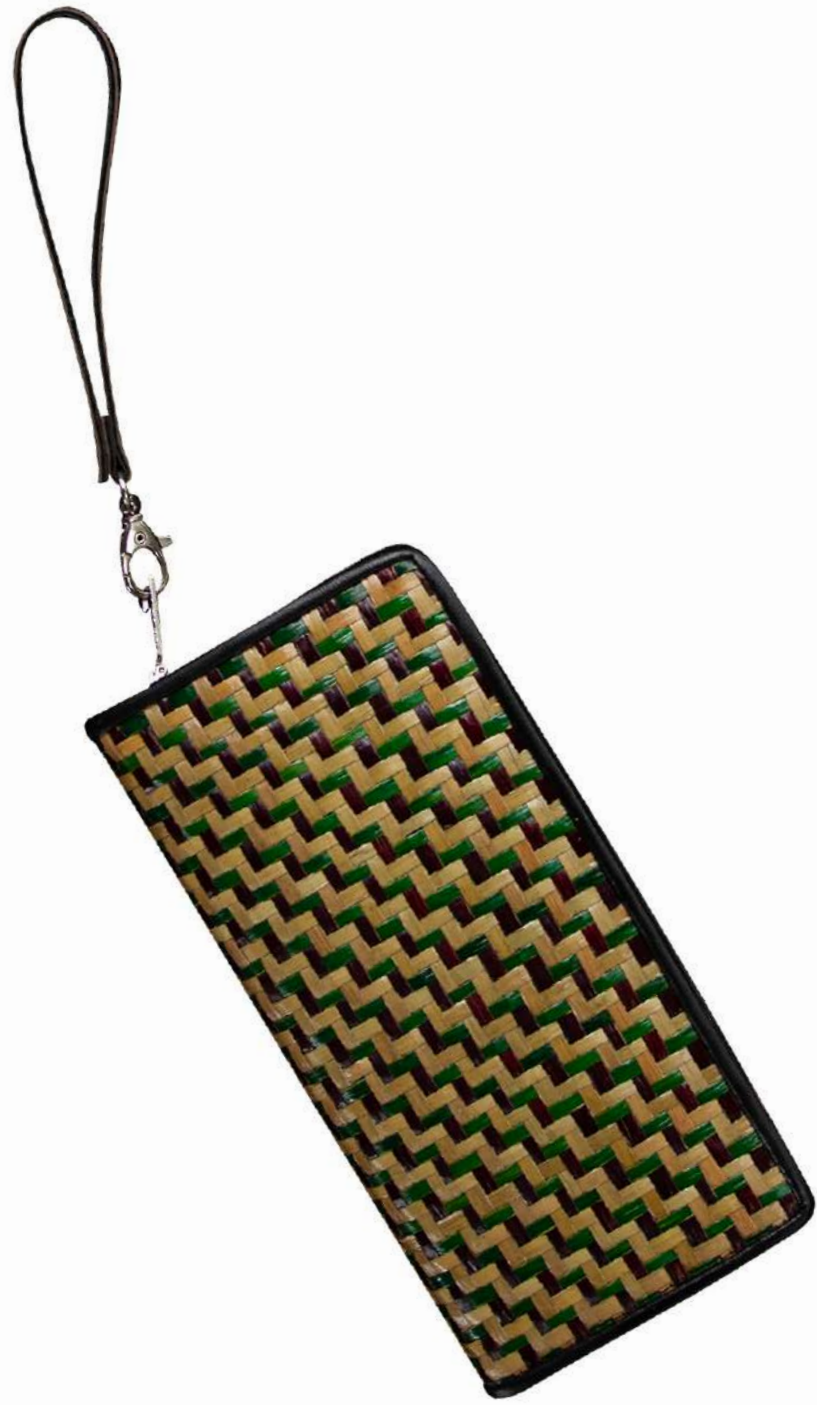
กระเป๋าจักสานกระจุด