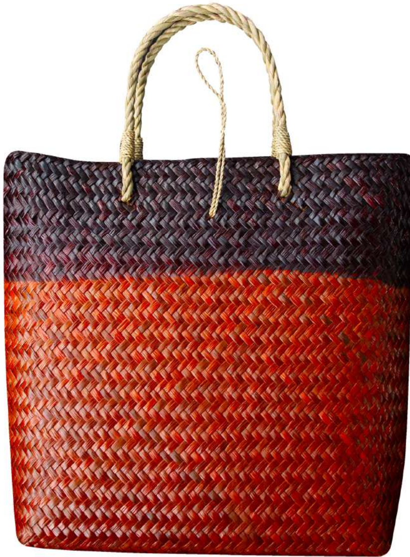
กระเป๋าจักสานกระจูด

“กระจูด” หรือ จูด เป็นวัชพืชที่เติบโตได้ง่าย และแพร่พันธุ์ได้รวดเร็ว พบมากแถบภาคตะวันออก และภาคใต้ของประเทศไทย กระจูดจะเกิดขึ้นเองตามธรรมชาติ เป็นพืชที่มีคุณสมบัติที่มีความเหนียว ยืดหยุ่นสูง มีความมันวาว ไม่ขาดง่ายแตกต่างจากวัสดุธรรมชาติทั่วไป เมื่อนำมาสานเป็นสิ่งของเครื่องใช้ จึงทำให้ผลงานมีความโดดเด่น และมีอายุการใช้งานที่ยาวนาน คนโดยทั่วไปนิยมนำกระจูดมาสานเป็นเสื่อ แต่ต่อมา กระจูดได้รับความนิยมเป็นอย่างมาก ผู้ทำงานหัตถกรรมจึงนำกระจูดมาสานเป็น กระเป๋า รองเท้า หมวก จนได้รับความนิยมอย่างต่อเนื่องมาจนถึงปัจจุบัน