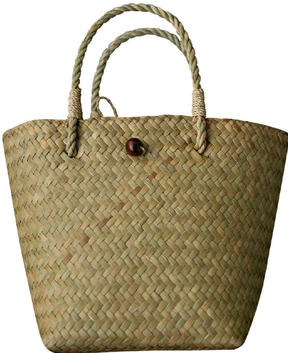
กระเป๋าจักสานกระจูด