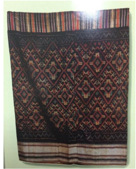
ภาพที่ ๘ “ซิ่นขิด” แขวงไชยบุรี ใช้ไหมเส้นเล็ก