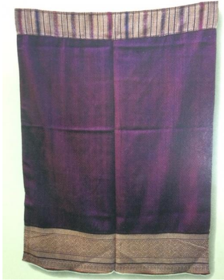
ภาพที่ ๗ “ซิ่นหมี่” ๙๒ x ๑๔๐ ซม. ลาวพวน ไชยบุรี เป็นซิ่นหมี่แบบลาวพวนในแถบลุ่มแม่น้ำโขง ลายดาวแปดแฉก และลายฟืนปลา ทอด้วยเทคนิคมัดหมี่ ตีนซิ่นเป็นแบบ ตำ แร ใช้ด้ายเงิน แสดงลักษณะซิ่นของราชสำนัก