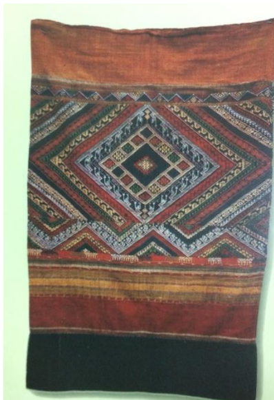
ภาพที่ ๕ “ชินจกลี้อ” ๑๐๔ x ๑๓๔ ซม. คริสต์ศตวรรษที่ ๒๐ ก่อนสงครามโลกครั้งที่ ๒ ชินจกแบบมาตรฐานไทลื้อจากหลวงพระบาง แสดงลักษณะลดลายรูปสามเหลี่ยม และสี่เหลี่ยมข้าวหลามตัด เย็บต่อหัวชินด้วยฝ้ายสีแดงและตีนวินด้วยฝ้ายสีคราม เพื่อให้ความยาวพอเหมาะแก่การนุ่ง