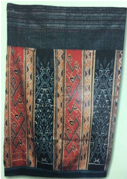
ภาพที่ ๑ “ซิ่นหัวบวน” ๙๗ x ๑๓๒ ซม. เป็นซิ่นแบบเก่าแก่ ของชาติไทแดง หัวซิ่นเรียกว่า “หัวบวน” ลวดลายมัดหมี่บน ตัวซิ่นสีน้ำเงิน และแดง แสดงลักษณะรูปนาคในรูปแบบที่ ต่างกัน มีลายทางคั่น ทอด้วยเทคนิคจก ผ้าซิ่นชนิดนี้ใช้นุ่งให้ ผู้ตายในพิธีศพ

ผ้าทอโบราณของลาวมีลวดลายที่งดงาม และหลากหลาย อย่างไรก็ตามยังไม่สามารถระบุถึงที่มาหรือต้น กำเนิดลวดลายเหล่านี้ได้อย่างแน่ชัด สันนิษฐานว่าอาจมีต้นกำเนิด ประมาณ ๔-๕๐๐ ถึงพันกว่าปีที่แล้ว ลวดลายส่วนมากคล้ายคลึงกับลายบนเครื่องสำริดยุคก่อนประวัติศาสตร์ ซึ่งพบในดินแดนแถบดองซอน ซึ่งมี อิทธิพลต่อผ้าทอและศิลปกรรมอื่นๆในดินแดนส่วนนี้ลงไปถึงทางใต้ รวมทั้งหมู่เกาะต่างๆ ตั้งแต่ ๕๐๐ ปีก่อน คริสตกาล และเมื่อไม่นานมานี้พิพิธภัณฑสถานแห่งชาติลาว ได้พบลายเส้นซิกแซก (ฟันเลื่อย) ประดับส่วนฐาน ของกลองสำริด (Heger I) มีอายุราว ๒,๒๐๐-๒,๕๐๐ ปี โดยค้นพบทางตอนใต้ของประเทศลาว ที่หมู่บ้านดอน ชัน เมืองโขง จ.จำปาสัก ซึ่งลายซิกแซกนี้ เป็นลายที่แพร่หลายในผ้าทอลาวจากหลายภาค และใช้เทคนิคการ ทอหลากหลายวิธี เช่น มัดหมี่ ขิด และจก