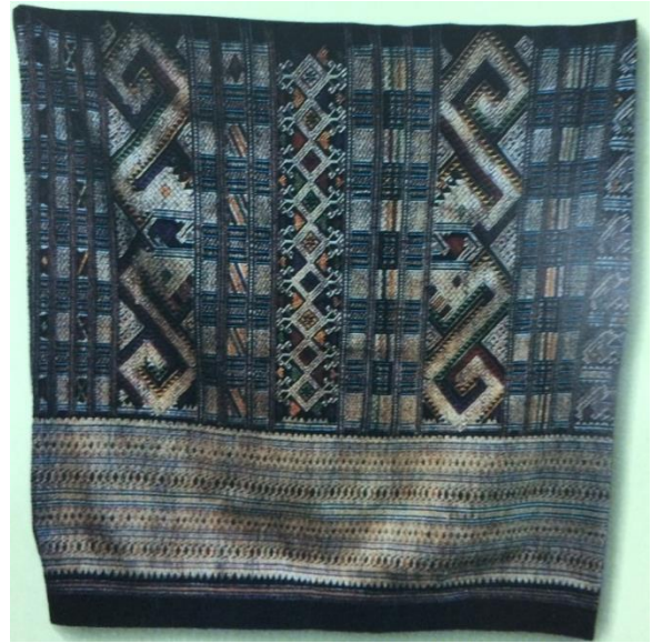
ภาพที่ ๔ “ชินจก” ๗๖ x ๑๕๖ ซม. ไทแดง แขวงหัวพัน ประเทศลาว ก่อนสงครามโลกครั้งที่ ๒ ชินแบบเก่าแก่ของชาวไทแดง มีการทอลดลายซิดและจกผสมกันกับรูปนาคใน ๕ แบบด้วยกัน