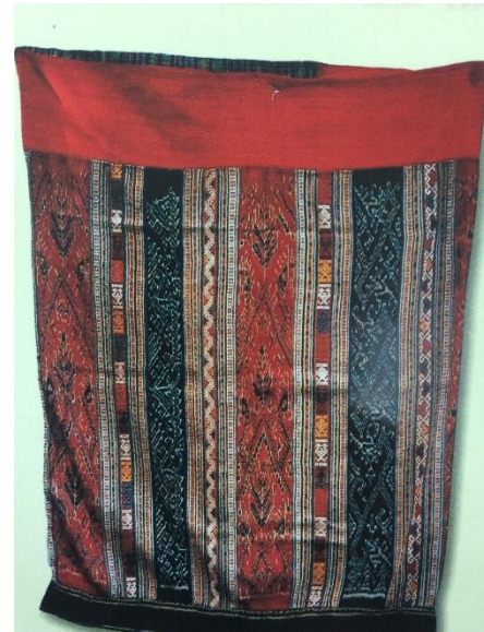
ภาพที่ 2 “ซิ่นหมี่” ๙๐ x ๑๔๐ ซม. ไทแดง แหวงหัวพัน ประเทศลาว ซิ่นเก่าแก่ดั้งเดิมของชาวไทแดง ลวดลายมัดหมี่รูปนาคสีแดง ทอด้วย ไหมสีคราม ทอด้วยฝ้าย มีลวดลายทางคั่นทอด้วยเทคนิคขิดและจก