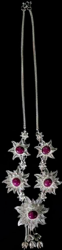
สร้อยคอเงินยัดลาย

แนวทางการขดเส้นเงินหรือเส้นทองแล้วขึ้นเป็นรูปสามมิติของช่างบ้านกาดนี้มี ความละม้ายคล้ายคลึงกับศิลปะการทำเครื่องประดับแบบโบราณแบบ Filigree จาก ประเทศต้นกำเนิดอย่างอียิปต์แตกต่างกันเฉพาะที่มีการสอดแทรกความเป็นไทยลง ไป มีความอ่อนช้อยของเส้นสายที่ได้แรงบันดาลใจจากสิ่งที่เป็นปรากฏการณ์ตาม ธรรมชาติ เช่น ดอกไม้ ใบไม้ เปลวไฟ เป็นต้น มาประดิษฐ์คิดดัดแปลงและจัดวางรูป จังหวะให้เป็นระเบียบกลมกลืนกัน