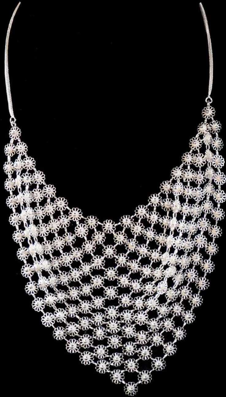
สร้อยคอเงินยัดลาย