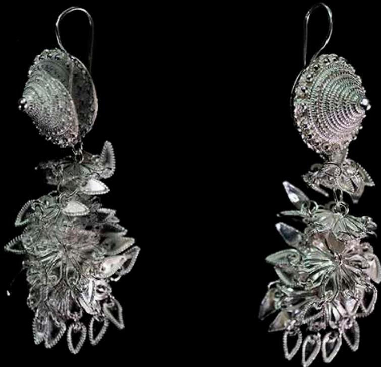
ต่างหูเงินยัดลาย