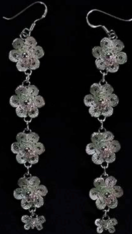
ต่างหูเงินยัดลาย

เสน่ห์ของเครื่องประดับเงินยัดลายอยู่ที่ความสวยงามและลวดลายที่สะท้อนให้เห็นถึงประเพณีวัฒนธรรมของชาวล้านนาที่ได้สร้างสรรค์ลวดลายลงบนเครื่องประดับในชิ้นงานต่าง ๆ ถือเป็นงานศิลปหัตถกรรมการทำเครื่องเงินยัดลายที่ละเอียดอ่อน