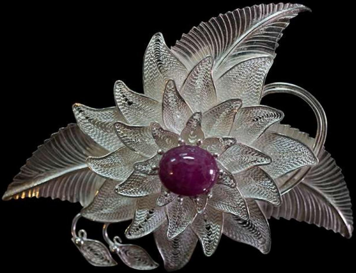
เข็มกลัดเงินยัดลาย