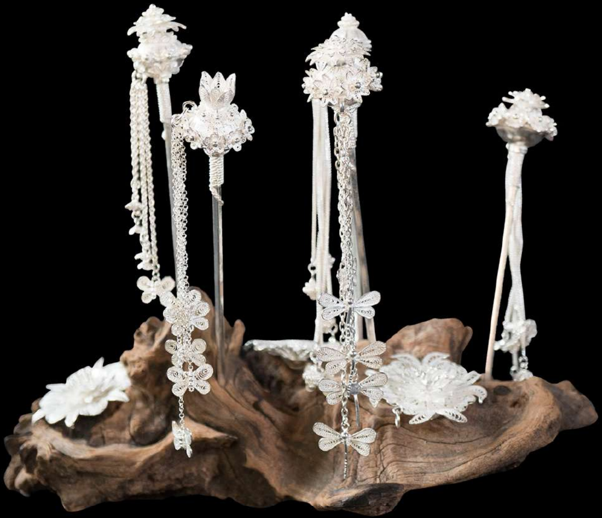
ปิ่นปักผมเงินยัดลาย