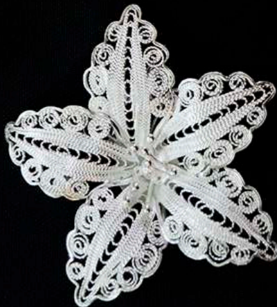
เข็มกลัดเงินยัดลาย