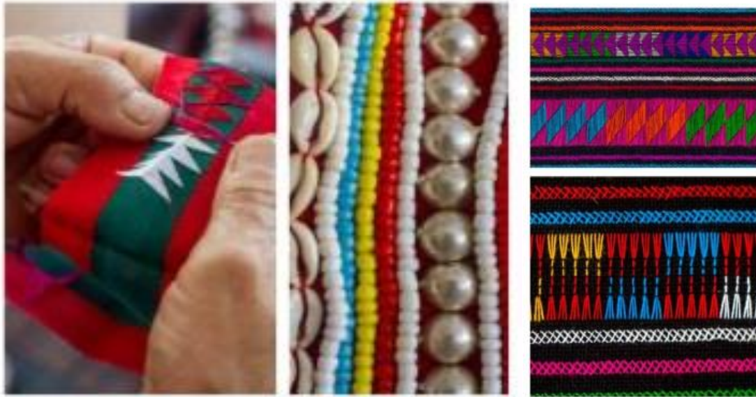
ทีมา หนังสือเอกลักษณ์และศิลปะลวดลายผ้าชาวเขา

ลวดลายผ้าปักอาข่าส่วนใหญ่จะปักเป็นรูปทรงเรขาคณิต เช่น รูปสามเหลี่ยม และสี่เหลี่ยม ส่วนลวดลายธรรมชาติได้จินตนาการมาจากสิ่งแวดล้อมที่อยู่รอบตัว เช่น ฝึเสื่อ นก ภูเขา ดอกไม้ และต้นไม้ เป็นต้น ลวดลายที่เป็นเอกลักษณ์ของชาวอาข่า ได้แก่ ลายฝึเสื่อ (ลายอาลูเหม่งล่า) ซึ่งลายนี้ชาวอาข่าทุกกลุ่มนำมาใช้ในการปักตกแต่งเสื้อผ้า สันนิฐานว่า ลายนี้ได้จินตนาการมาจากฝึเสื่อที่ได้พบเห็นขณะเดินทางไปทำไร่ทำนา จึงได้นำมาประยุกต์เป็นลวดลายในการปักผ้า โดยนำลวดลายมาตกแต่งที่ผ้ารัดน่อง เพราะเป็นผ้าที่มีขนาดเล็กใช้เวลาในการปักน้อยกว่าตัวเสื่อ ปัจจุบันลวดลายผ้าปักอาข่าได้เปลี่ยนแปลงไปจากเดิม เนื่องจากได้นำลวดลายของผ้าปักเผ่าอื่นๆ มาปักผสมผสานกับลวดลายของอาข่าสำหรับตกแต่งบนเสื้อผ้า เช่น ลวดลายผ้าปักของชาวเขาเผ่าม้ง นอกจากนี้ยังพบว่า ชาวอาข่าได้เลียนแบบลวดลายการปักของอาข่ากลุ่มอื่นๆ เช่น กลุ่มลอบืออาข่า กลุ่มอุโล๊ะอาข่า เป็นต้น สันนิฐานว่า สาเหตุของการนำลวดลายอื่นมาปักร่วม