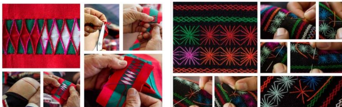
ลวดลายบนผืนผ้าปักอาข่า

ลวดลายผ้าปักอาข่าส่วนใหญ่จะปักเป็นรูปทรงเรขาคณิต เช่น รูปสามเหลี่ยม และสี่เหลี่ยม ส่วนลวดลายธรรมชาติได้จินตนาการมาจากสิ่งแวดล้อมที่อยู่รอบตัว เช่น ฝึเสื่อ นก ภูเขา ดอกไม้ และต้นไม้ เป็นต้น ลวดลายที่เป็นเอกลักษณ์ของชาวอาข่า ได้แก่ ลายฝึเสื่อ (ลายอาลูเหม่งล่า) ซึ่งลายนี้ชาวอาข่าทุกกลุ่มนำมาใช้ในการปักตกแต่งเสื้อผ้า สันนิฐานว่า ลายนี้ได้จินตนาการมาจากฝึเสื่อที่ได้พบเห็นขณะเดินทางไปทำไร่ทำนา จึงได้นำมาประยุกต์เป็นลวดลายในการปักผ้า โดยนำลวดลายมาตกแต่งที่ผ้ารัดน่อง เพราะเป็นผ้าที่มีขนาดเล็กใช้เวลาในการปักน้อยกว่าตัวเสื่อ ปัจจุบันลวดลายผ้าปักอาข่าได้เปลี่ยนแปลงไปจากเดิม เนื่องจากได้นำลวดลายของผ้าปักเผ่าอื่นๆ มาปักผสมผสานกับลวดลายของอาข่าสำหรับตกแต่งบนเสื้อผ้า เช่น ลวดลายผ้าปักของชาวเขาเผ่าม้ง นอกจากนี้ยังพบว่า ชาวอาข่าได้เลียนแบบลวดลายการปักของอาข่ากลุ่มอื่นๆ เช่น กลุ่มลอบืออาข่า กลุ่มอุโล๊ะอาข่า เป็นต้น สันนิฐานว่า สาเหตุของการนำลวดลายอื่นมาปักร่วม