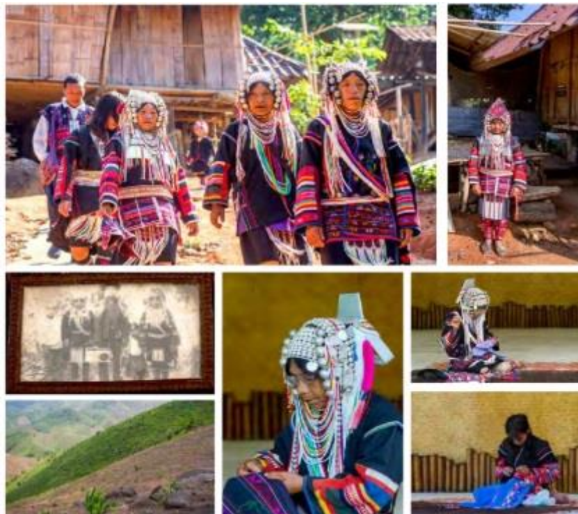
ที่มา หนังสือเอกลักษณ์และศิลปะลวดลายผ้าชาวเขา