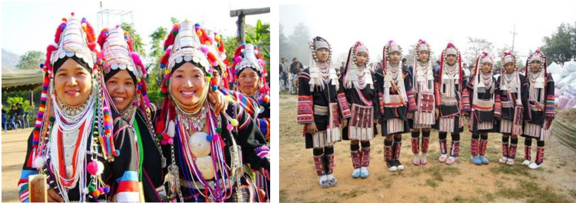
ที่มา หนังสือเอกลักษณ์และศิลปะลวดลายผ้าชาวเขา

การปักผ้าของชาวอาข่าได้จินตนาการลวดลายมาจากวิถีชีวิตประจำวันของตนเอง และอีกส่วนหนึ่งได้รับการถ่ายทอดวิธีการปักผ้ามาจากบรรพบุรุษ ชาวอาข่าส่วนใหญ่จะปักผ้าเพื่อสวมใส่เอง เนื่องจากการปักผ้าเป็นงานฝีมือ ต้องใช้เวลาในการปักนาน ลายปักมีความละเอียด ประณีต จึงทำให้มีราคาแพง ผู้หญิงจะปักเสื้อผ้าให้คนในครอบครัว และปักเพื่อสวมใส่เอง ชาวอาข่าให้ความสำคัญกับชุดประจำเผ่า ประกอบไปด้วย เสื้อ กระโปรง หรือกางเกง ผ้ารัดน่อง เข็มขัด และหมวก ซึ่งหมวกจะนิยมใช้เพียงใบเดียวตลอดชีวิต โดยเฉพาะหมวกที่ทำจากเครื่องเงินแท้ มีราคาแพง และไม่สามารถประเมินราคาได้ส่วนเสื้อประจำเผ่า นั้น ชาวอาข่าจะมีประมาณ ๒ - ๓ ตัว ต่อคน ผู้หญิงชนเผ่าอาข่าเมื่อแต่งงานครบสมบูรณ์ จะมีความสุขเป็นอย่างมาก หากใครที่มีความขยันจะตัดเย็บเสื้อ และปักลวดลายขึ้นมาใหม่ นอกจากนี้ ยังมีชาวอาข่าบางส่วน คิดว่าการปักเสื้อใส่เองทำให้เสียเวลา เนื่องจากต้องใช้เวลาส่วนใหญ่ในการทำไร่ ทำสวน จึงไม่มีเวลาปักผ้า และอีกเหตุผลหนึ่งคือ เสื้อผ้าที่ซื้อ มีราคาถูกลงกว่าเย็บเอง จึงซื้อลายที่ปักสำเร็จมาใช้ และตกแต่งวัสดุอื่นๆ เพิ่มเติมเพื่อให้เกิดความสวยงาม