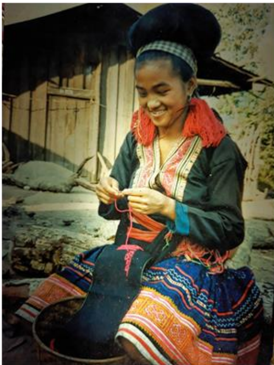
ภาพแสดงชุดเสื้อผ้าม้งเขียว

- แนวคิดสุดท้าย สันนิษฐานว่า ม้งเป็นชนดั้งเดิมในจีน (aboriginal Chinese) โดยแรกเริ่มตั้งถิ่นฐานอยู่ทางด้านตะวันออกของทะเลเหลือง จากนั้นได้เคลื่อนย้ายทำมาหากินตามแม่น้ำฮวงโห เข้ามาสู่บริเวณที่เป็นภาคกลางของจีน ต่อมาถูกรุกรานจากชาวมองโกลจึงได้อพยพลงมายังทางตะวันตกเฉียงใต้ ซึ่งปัจจุบันเป็นมณฑลเสฉวน กวางสี และยูนนาน ทั้งนี้ ภายหลังจากช่วงกลางศตวรรษที่ 18 เกิดสงครามการต่อต้านรัฐบาลส่วนกลางปักกิ่งที่ทำการขูดรีด และการเก็บภาษีสูงจากกลุ่มผู้มีอำนาจในจีน ส่งผลให้ม้งส่วนหนึ่งได้อพยพออกจากดินแดนในจีนเข้ามายังพื้นที่บริเวณแถบอินโดจีนเพื่อการตั้งถิ่นฐาน และการทำมาหากินใหม่ ซึ่งปัจจุบันเป็นประเทศเวียดนาม ลาว พม่า และไทย