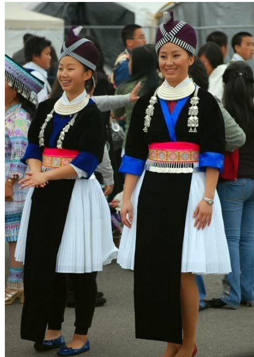
ภาพแสดงชุดเสื้อผ้าม้งขาว