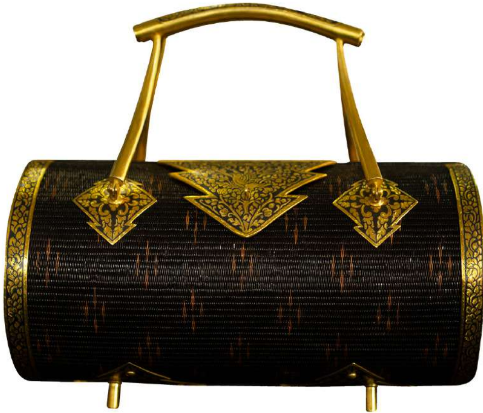
กระเป๋าจักสานย่านลิเภา