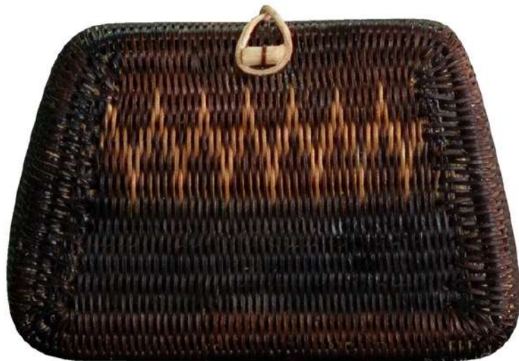
กระเป๋าจักสานย่านลิเภา