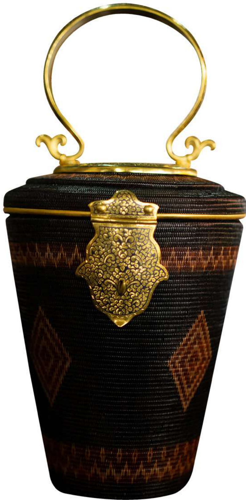
กระเป๋าจักสานย่านลิเภา