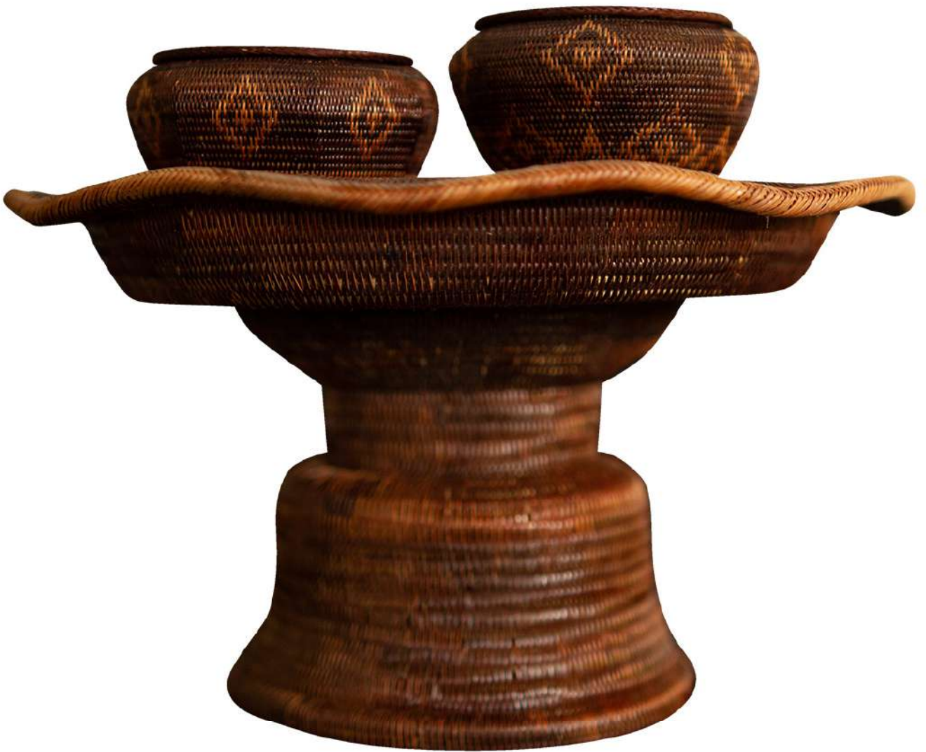
พานจักสานย่านลิเภา