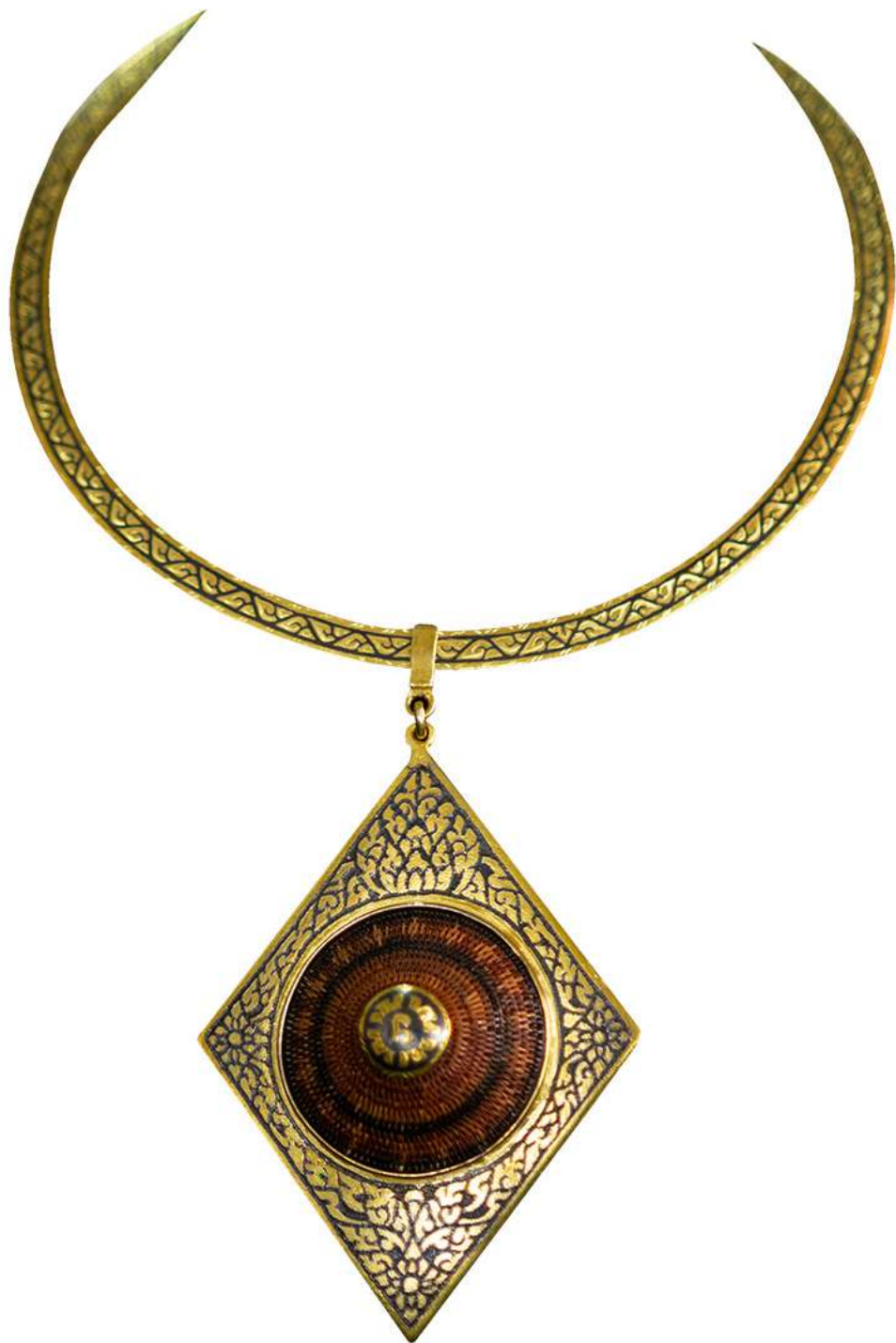
จี้จักसानย่านลิเกา