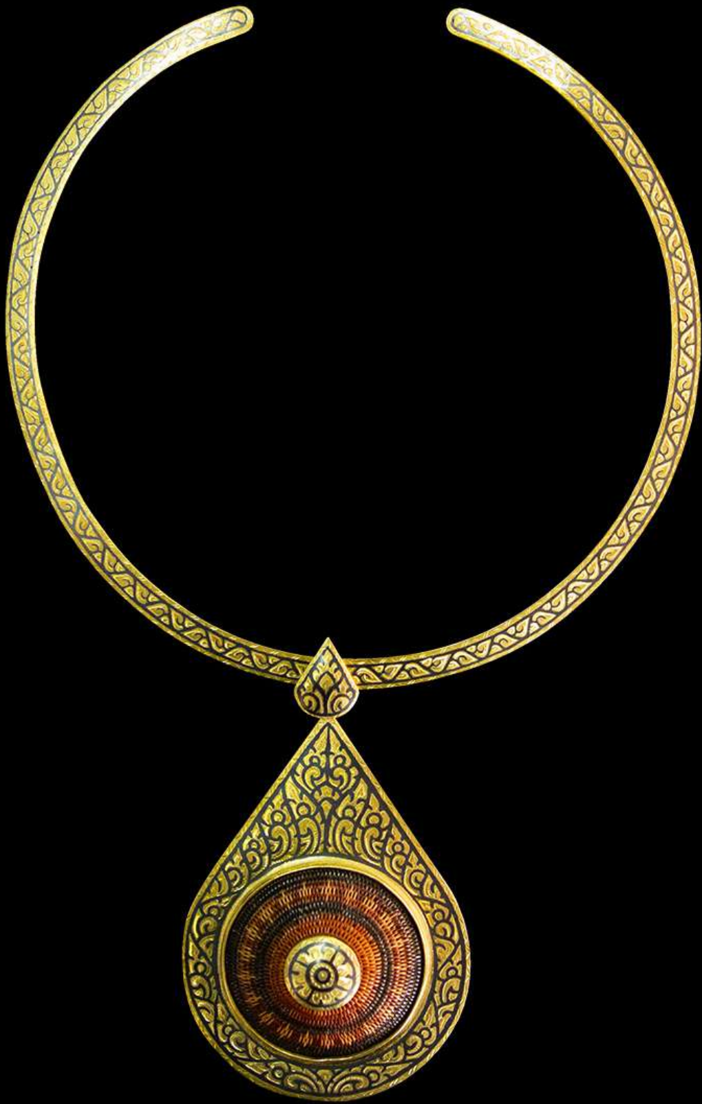
จี้จ๊กसानย่านลิเกา