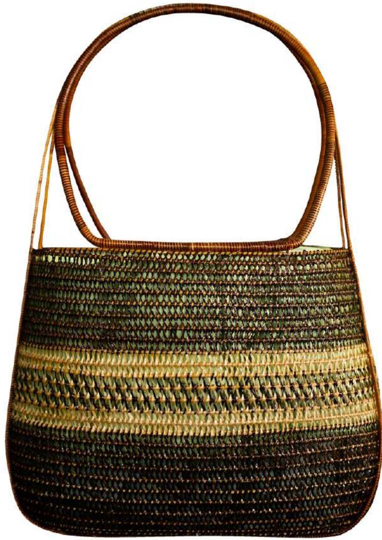
กระเป๋าจักสานย่านลิเภา