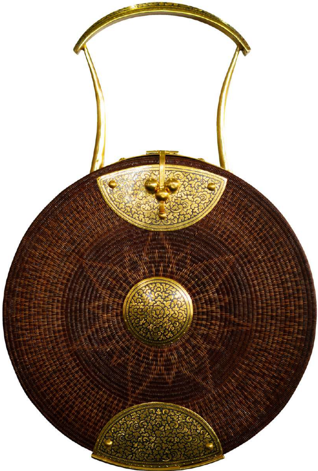
กระเป๋าจักสานย่านลิเภา