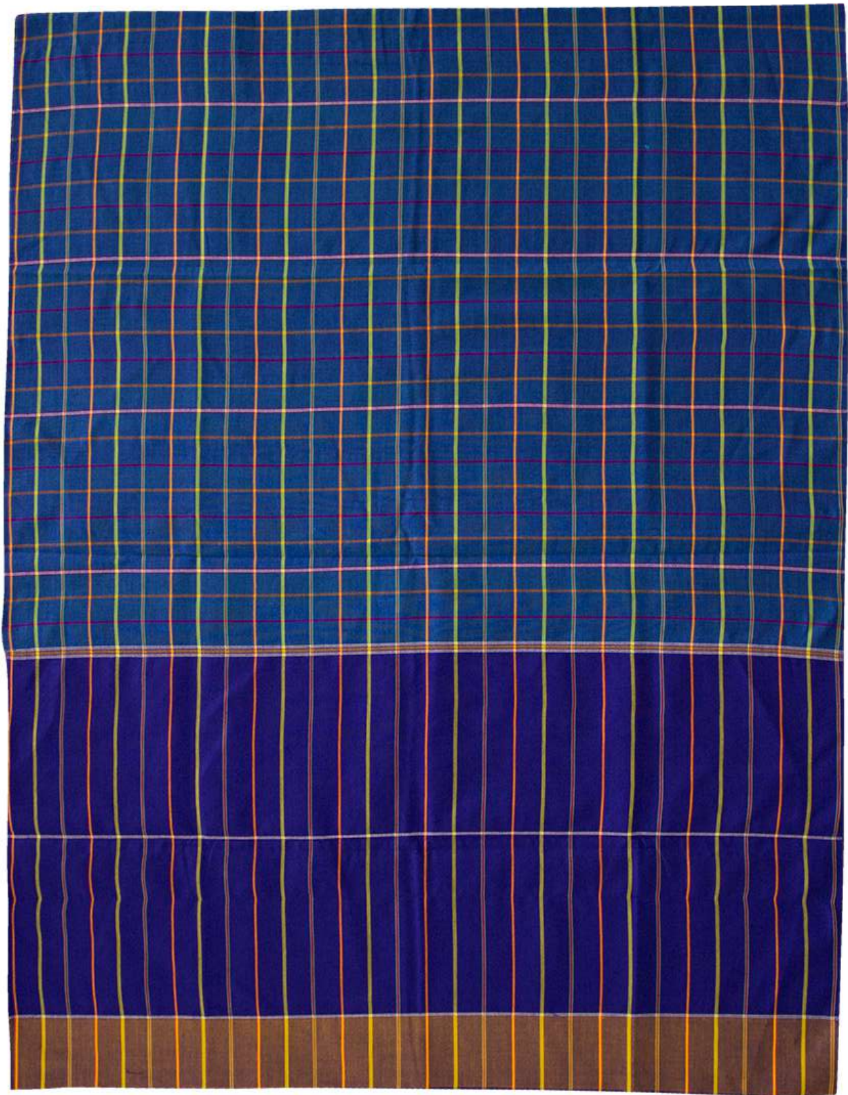
ผ้าขาวม้าร้อยสี