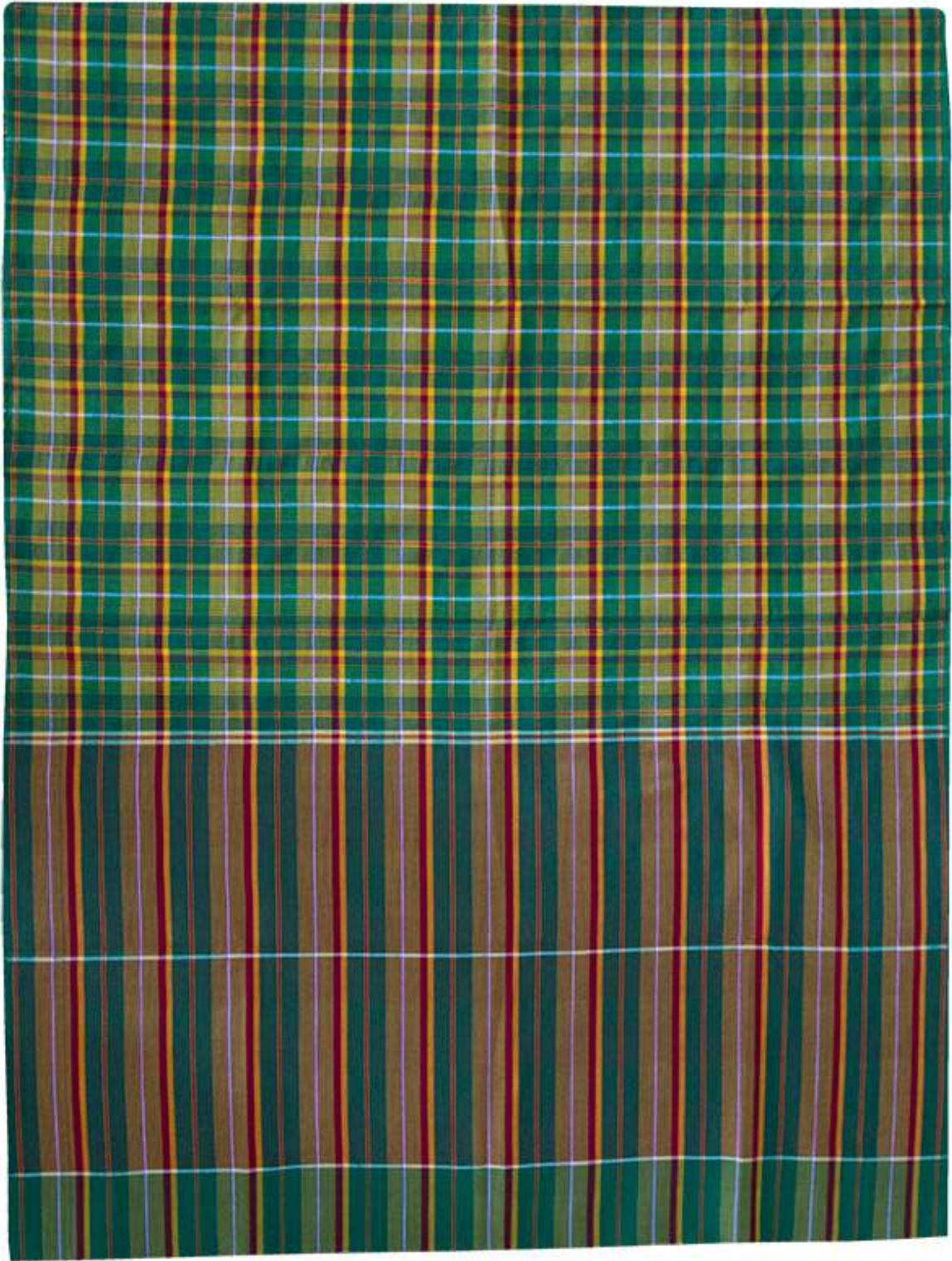
ผ้าขาวม้าร้อยสี