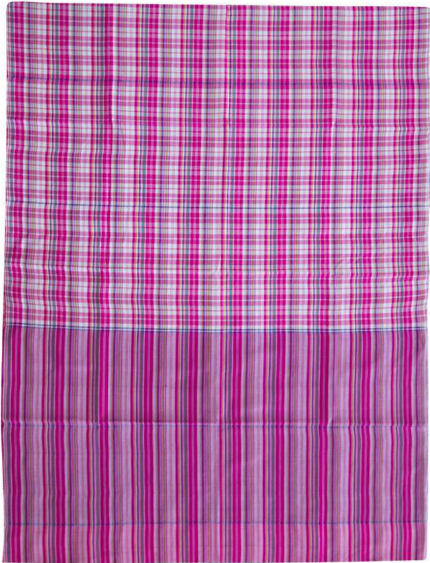
ผ้าขาวม้าร้อยสี