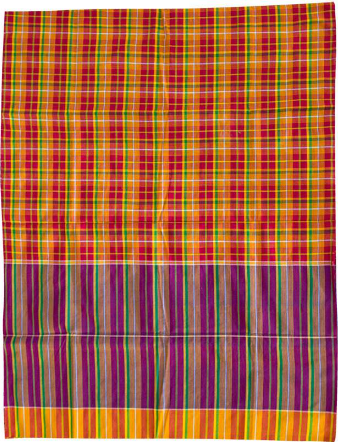
ผ้าขาวม้าร้อยสี