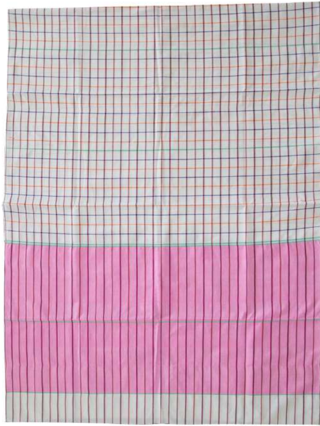
ผ้าขาวม้าร้อยสี