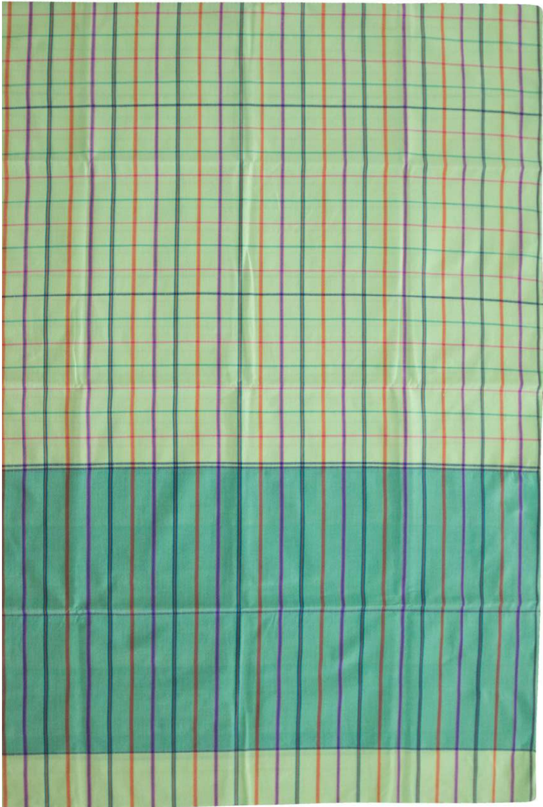
ผ้าขาวม้าร้อยสี