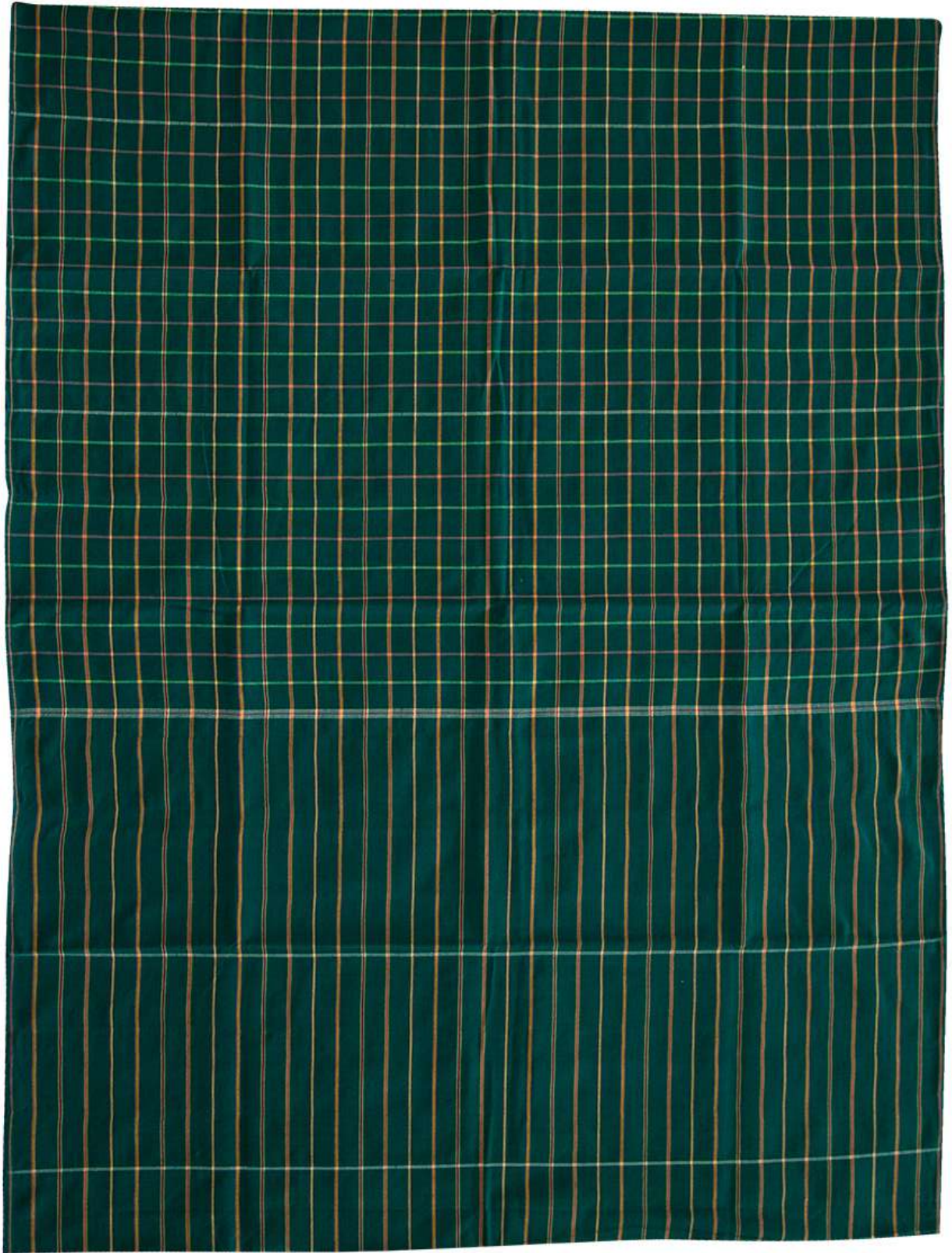
ผ้าขาม้าร้อยสี