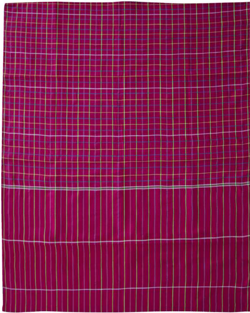
ผ้าขาวม้าร้อยสี