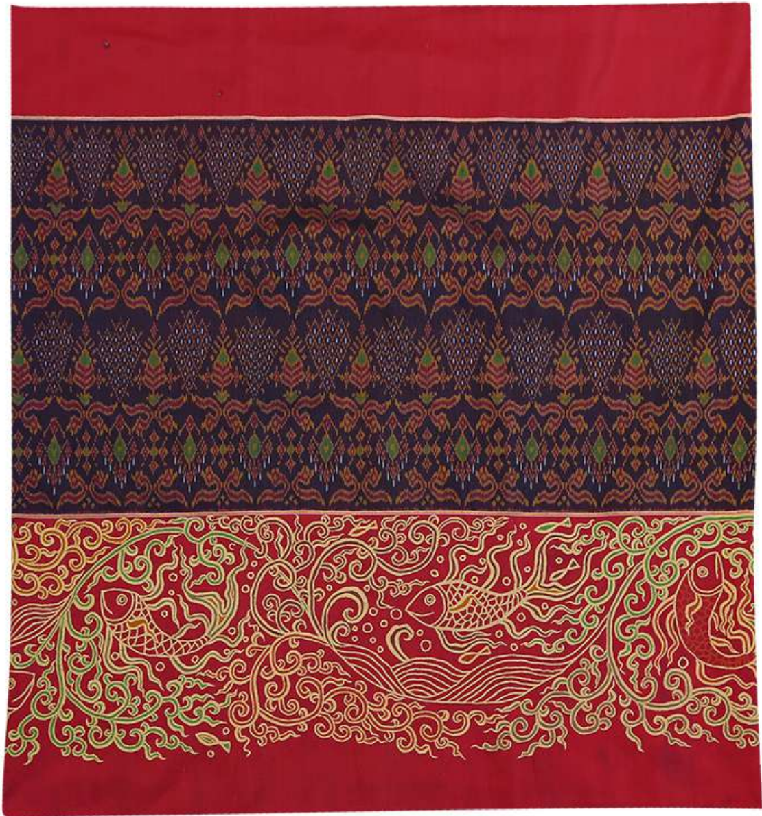
ผ้าปักมือล้านนา