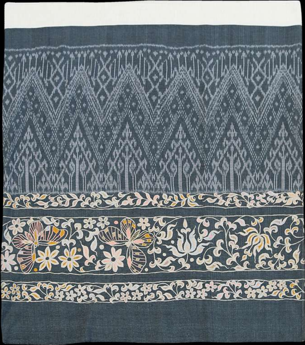
ผ้าปักมือล้านนา