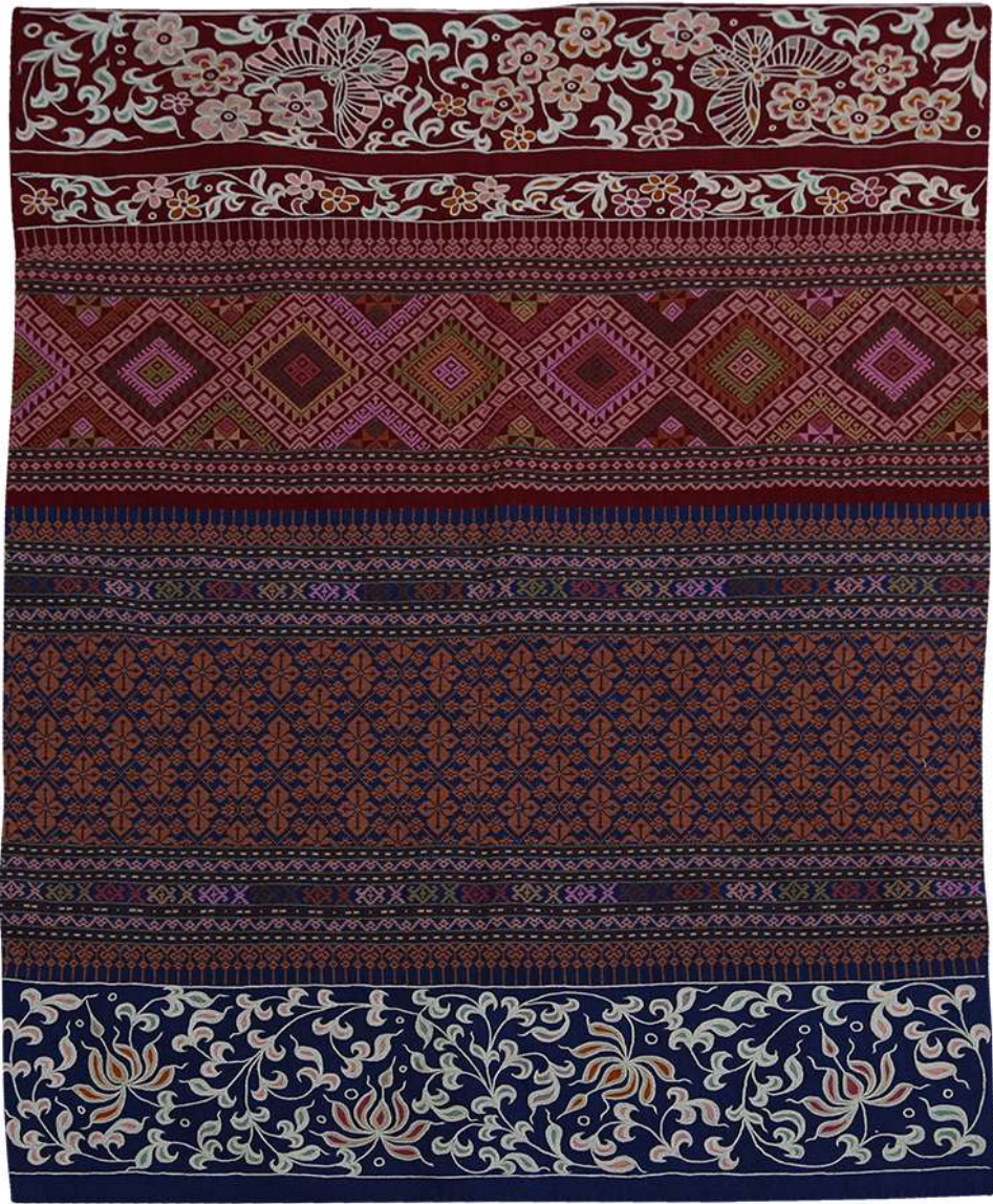
ผ้าปักมือล้านนา