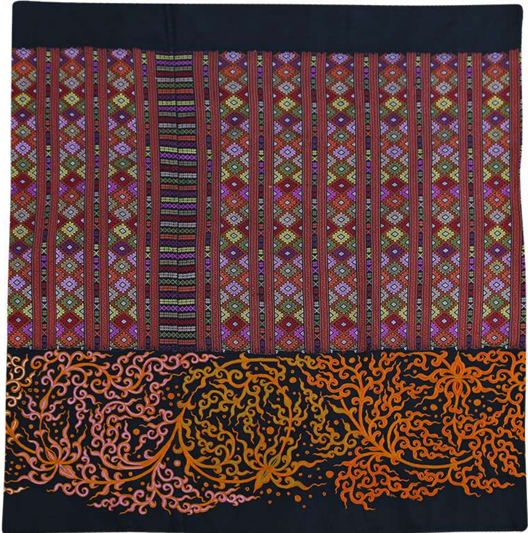
ผ้าปักมือล้านนา