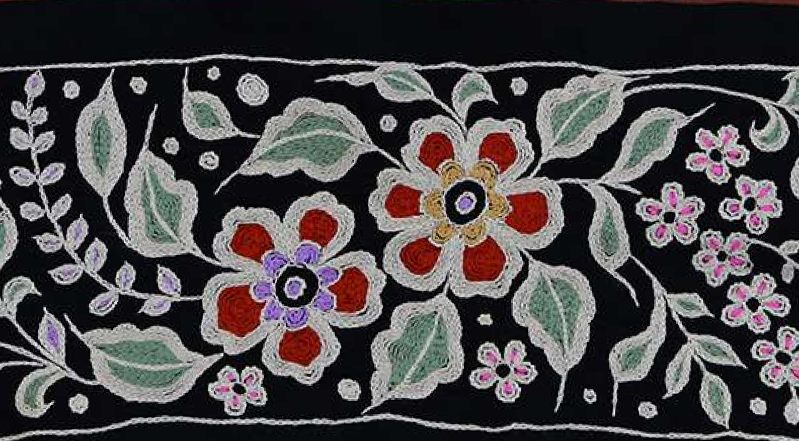
ผ้าปักมือล้านนา