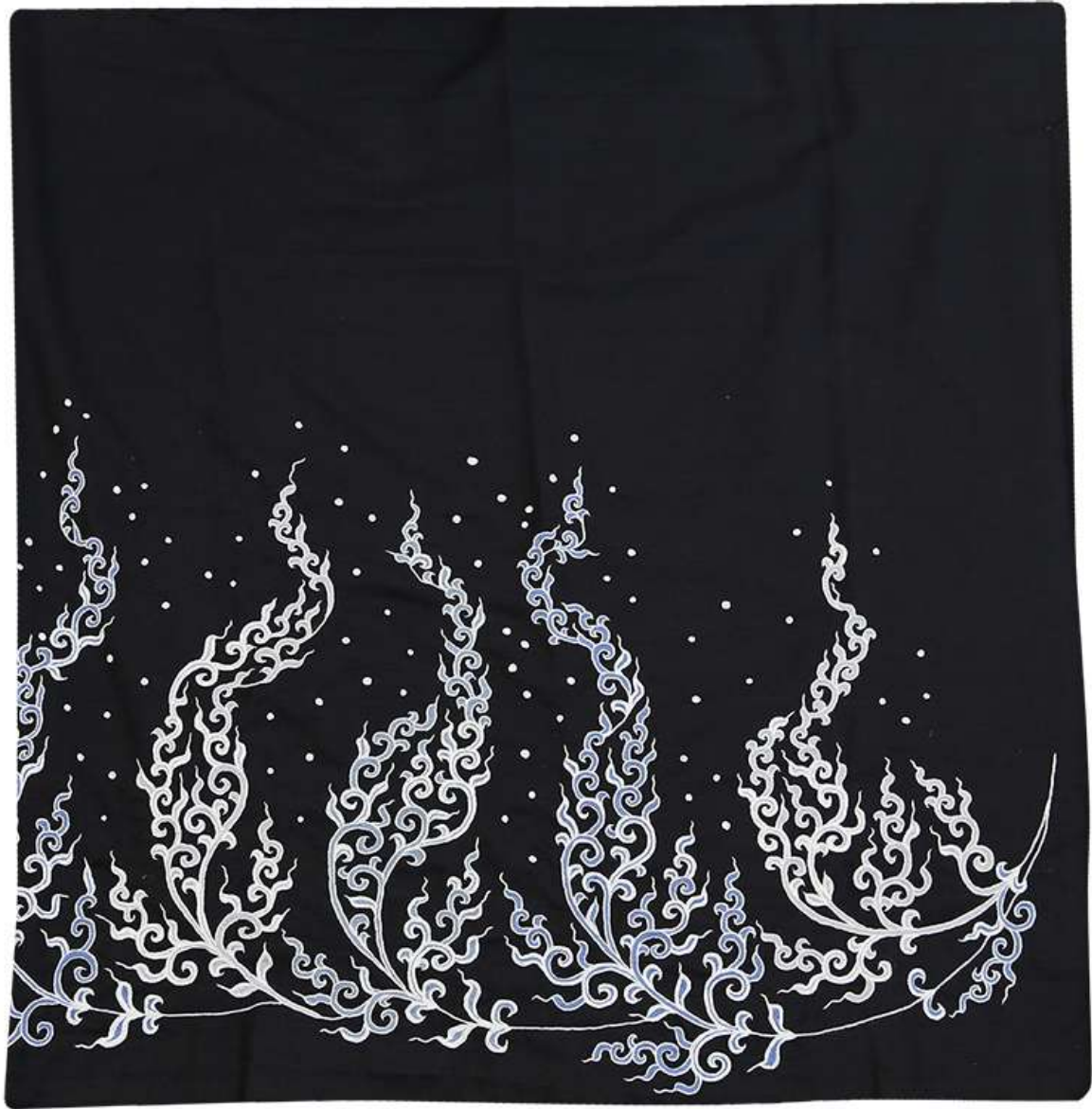
ผ้าปักมือล้านนา