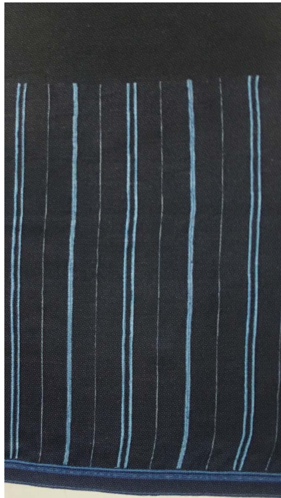
ผ้าซิ่นแดงโม มีเชิง