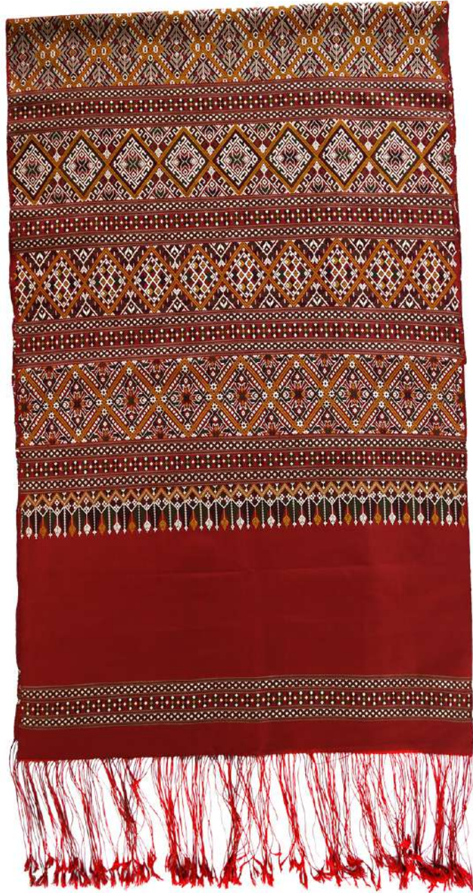
ผ้าแพรวา