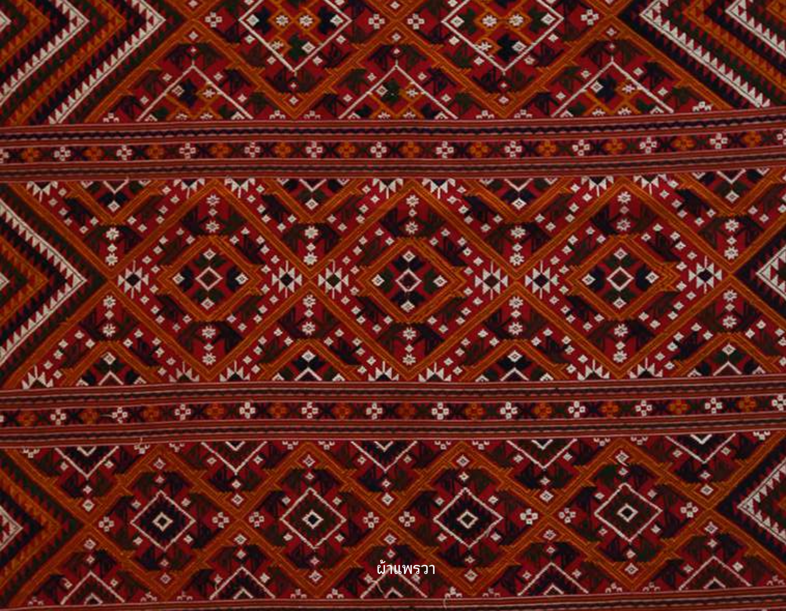
ผ้าแพรวา