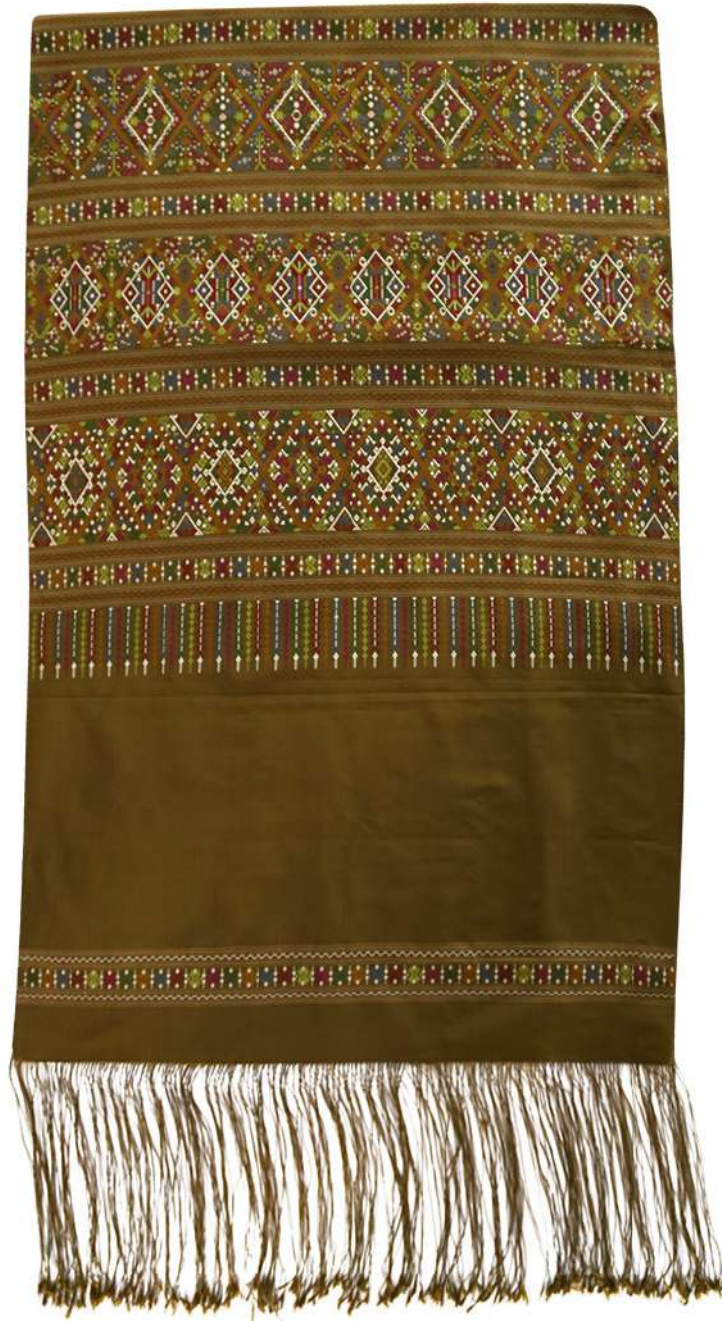
ผ้าแพรวา