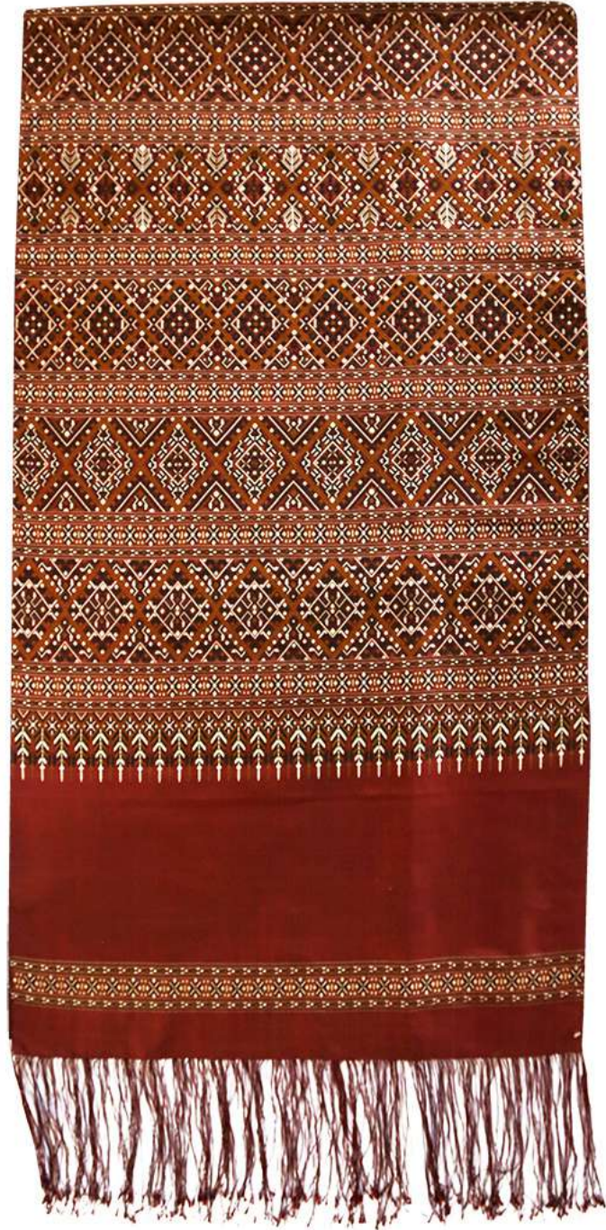
ผ้าแพรวา