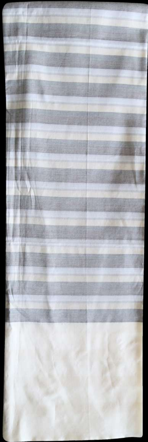
ผ้าขาวม้า