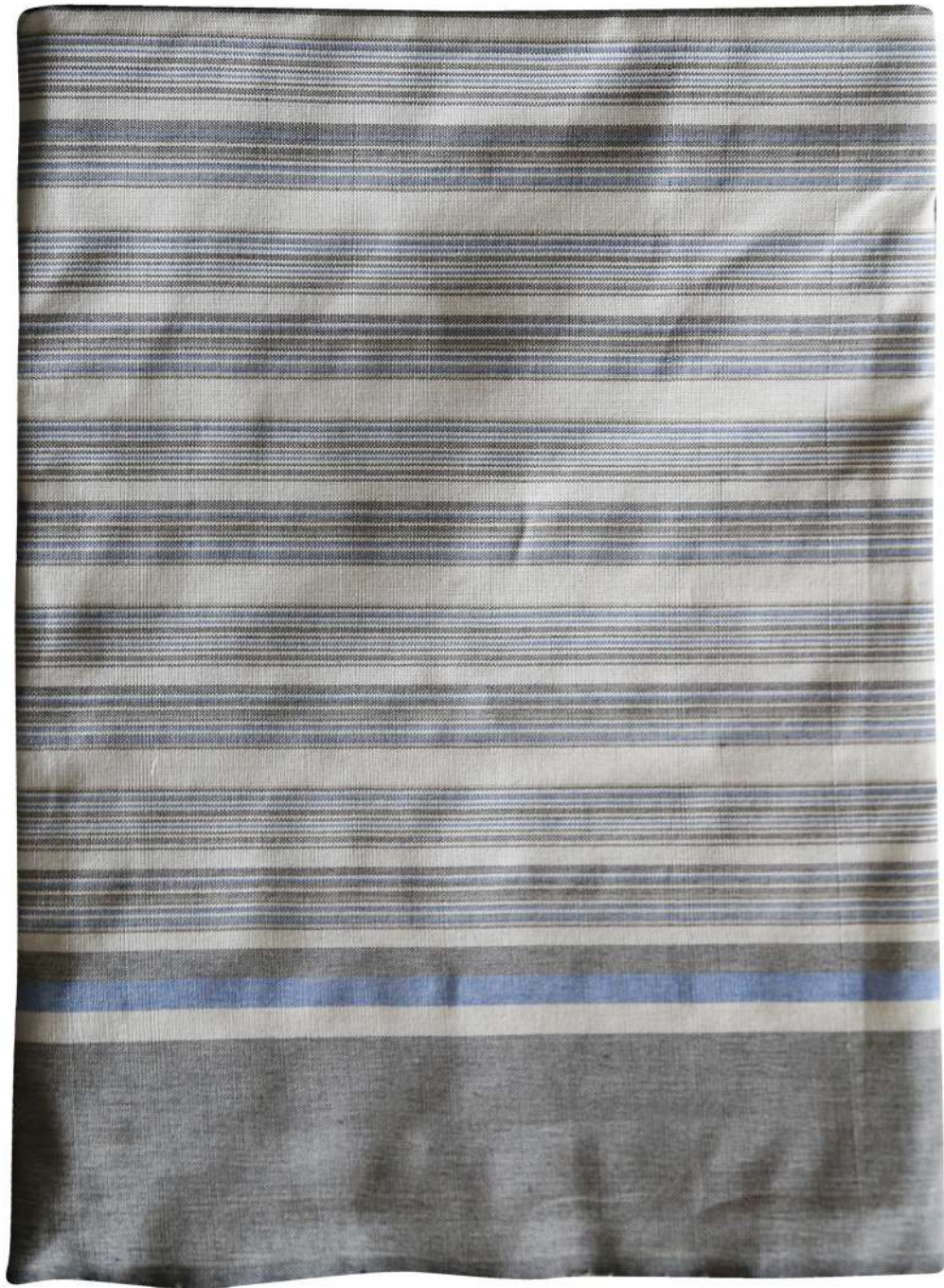
ผ้าลายขวาง