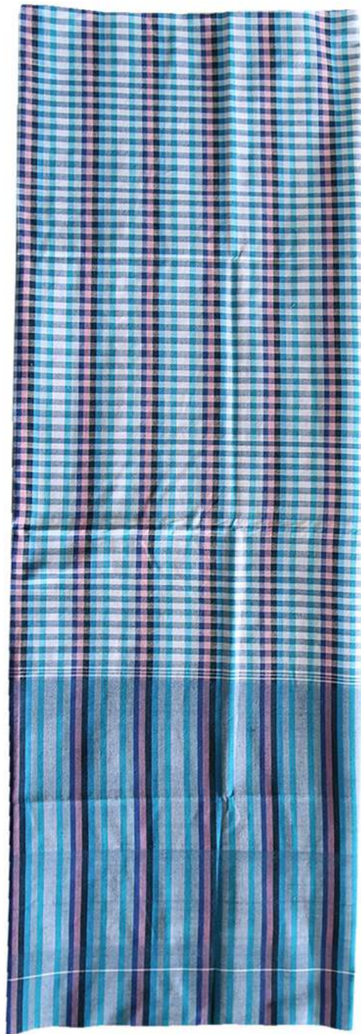
ผ้าขาวม้า