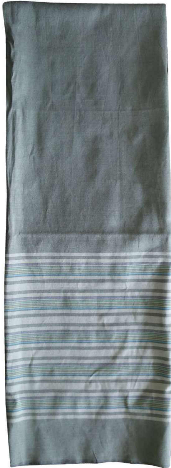
ผ้าชีนลายขวาง