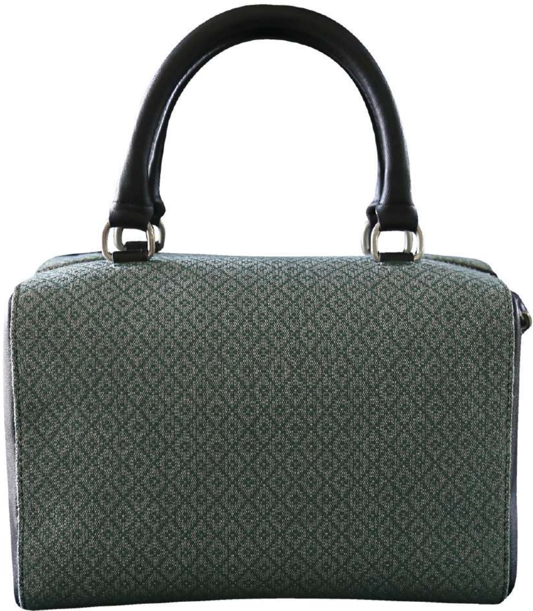
กระเป๋ายกดอก