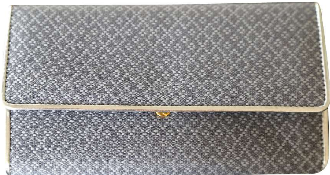
กระเป๋าผ้ายกดอก