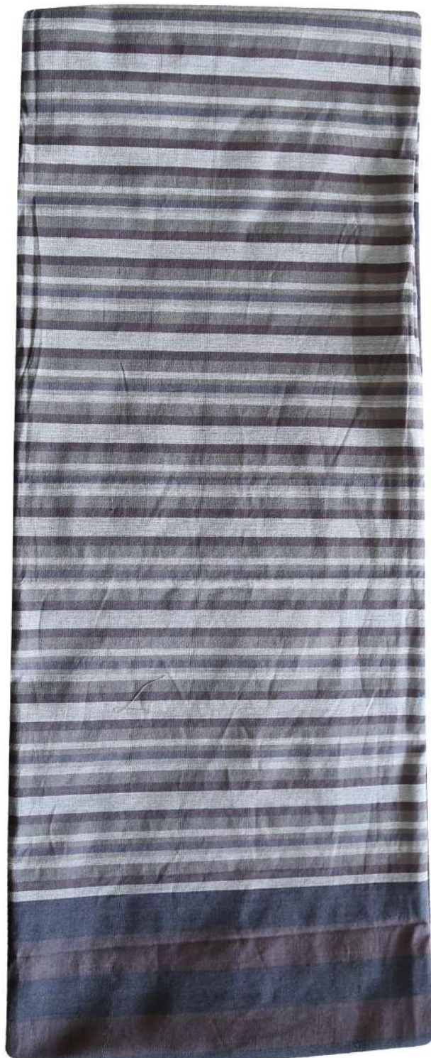
ผ้าชาวม้า