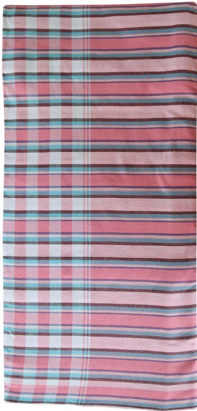
ผ้าขาวม้า