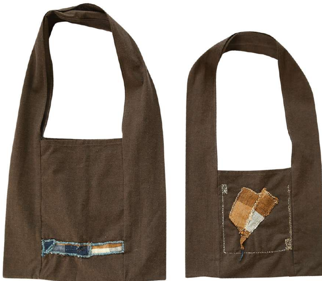
ถุงย่ามข้อมสี่ธรรมชาติ