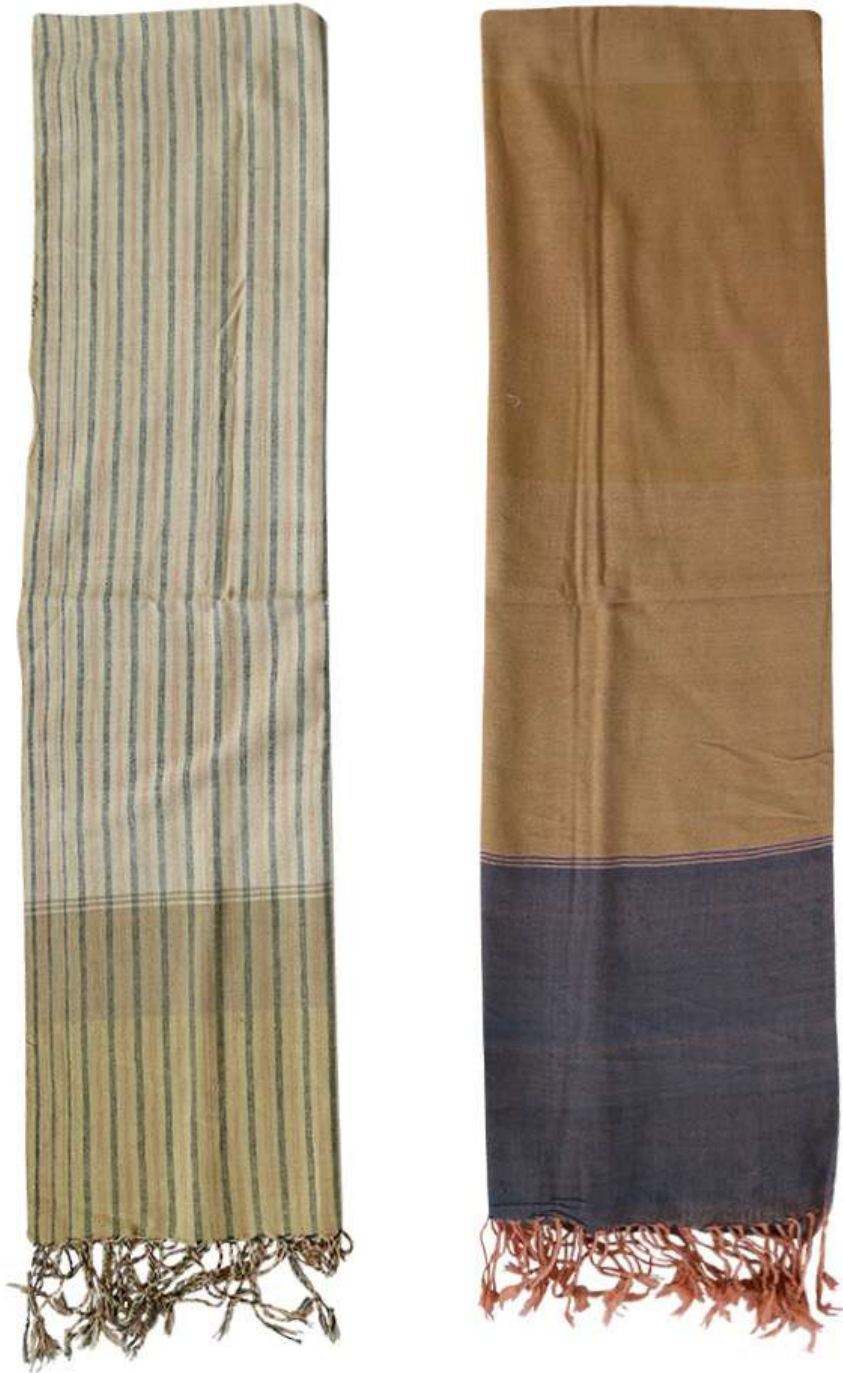
ผ้าฝ้ายย้อมสีธรรมชาติ