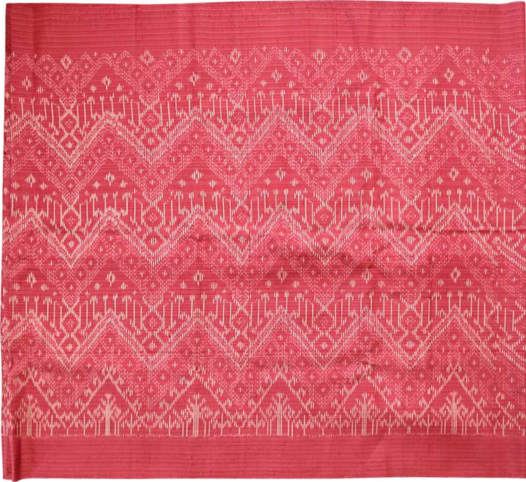
ผ้าฝ้ายย้อมสีธรรมชาติ