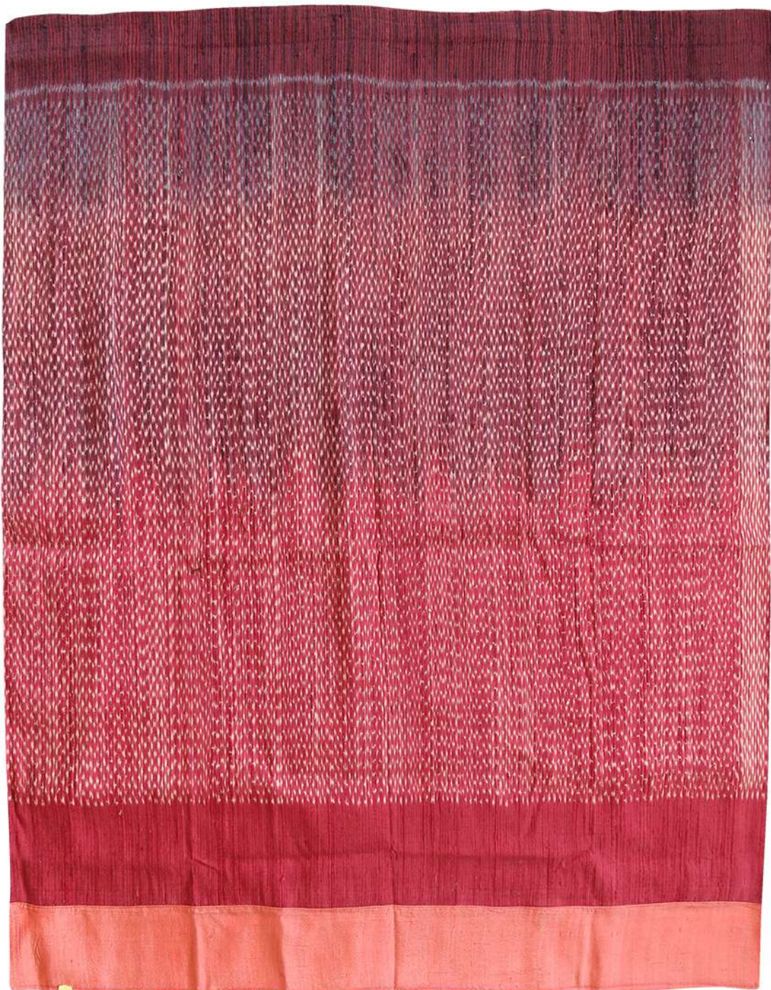
ผ้าฝ้ายข้อมสี่ธรรมชาติ