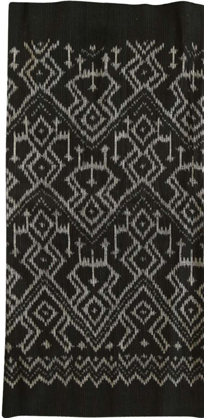
ผ้าฝ้ายย้อมสีธรรมชาติ