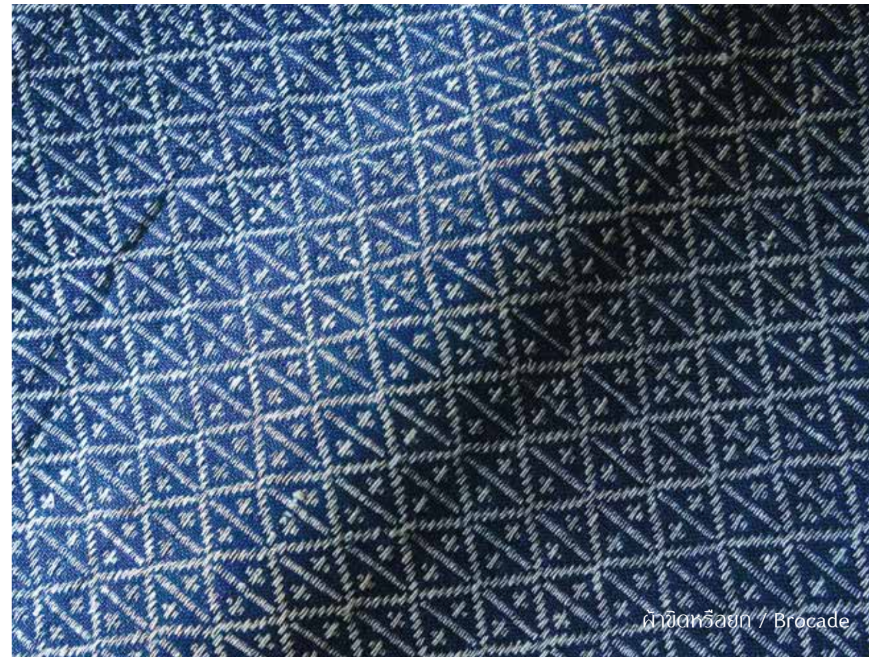
ผ้าชีดหรือยัก / Brocade