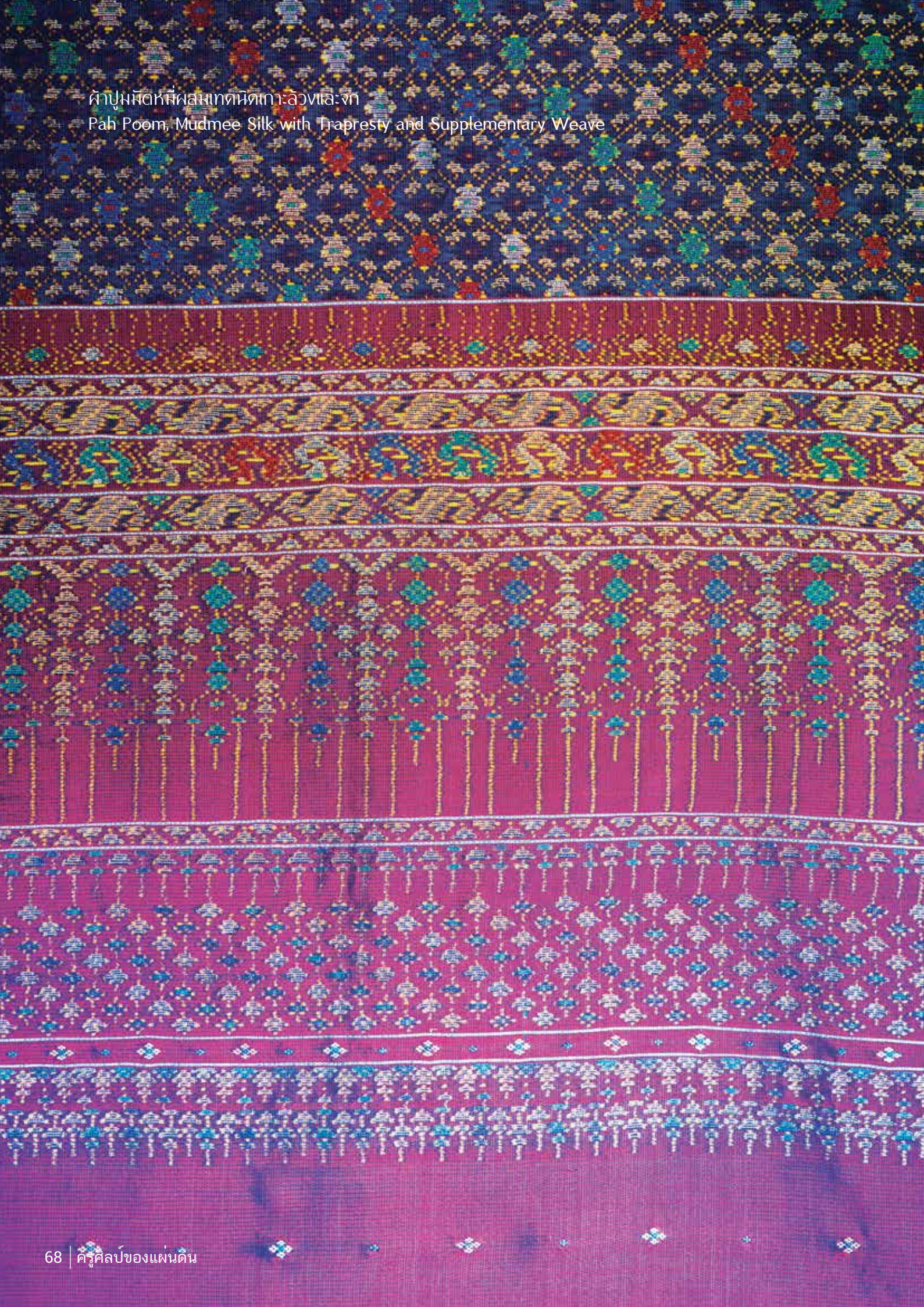
ผ้าปูมมัดหมี่ผสมเทคนิคหัตถ์ทอ ลวดเล็งจก Pah Poom, Mudmee Silk with Trapresty and Supplementary Weave