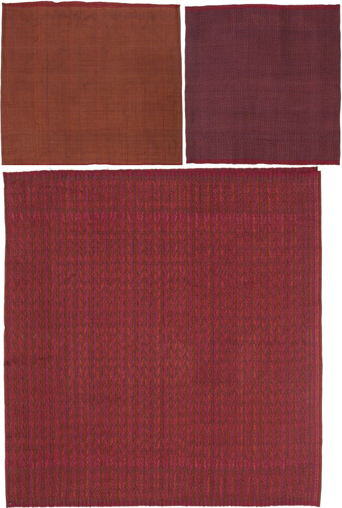
ผ้าอัมปรม