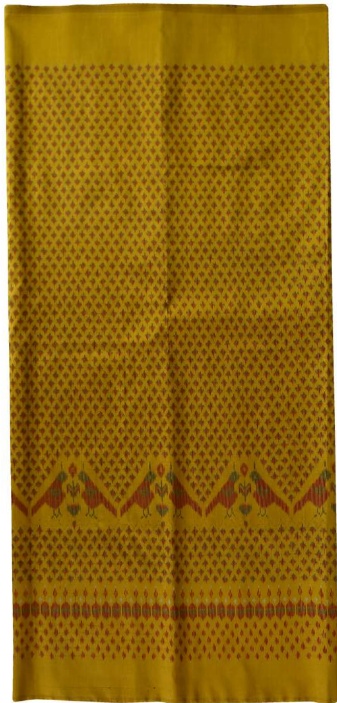
ผ้าไหมมัดหมี่ ลายสร้อยดอกหมาก