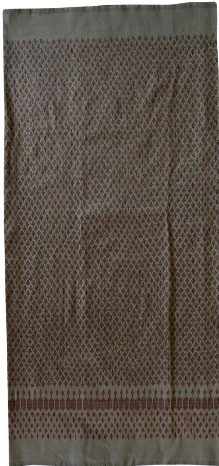
ผ้าไหมมัดหมี่ ลายสร้อยดอกหมาก