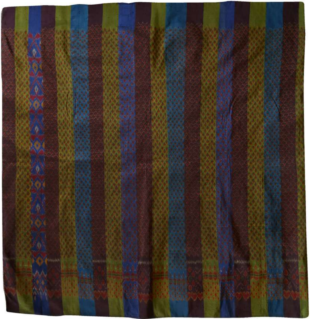
ผ้าไหมมัดหมี่ ลายสร้อยดอกหมาก