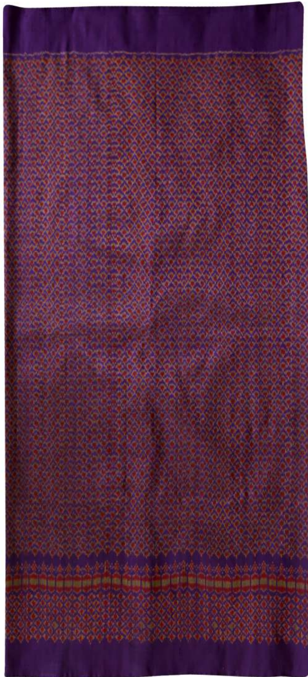
ผ้าไหมมัดหมี่ ลายสร้อยดอกหมาก