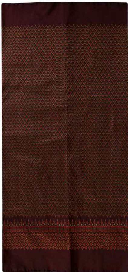
ผ้าไหมมัดหมี่ ลายสร้อยดอกหมาก