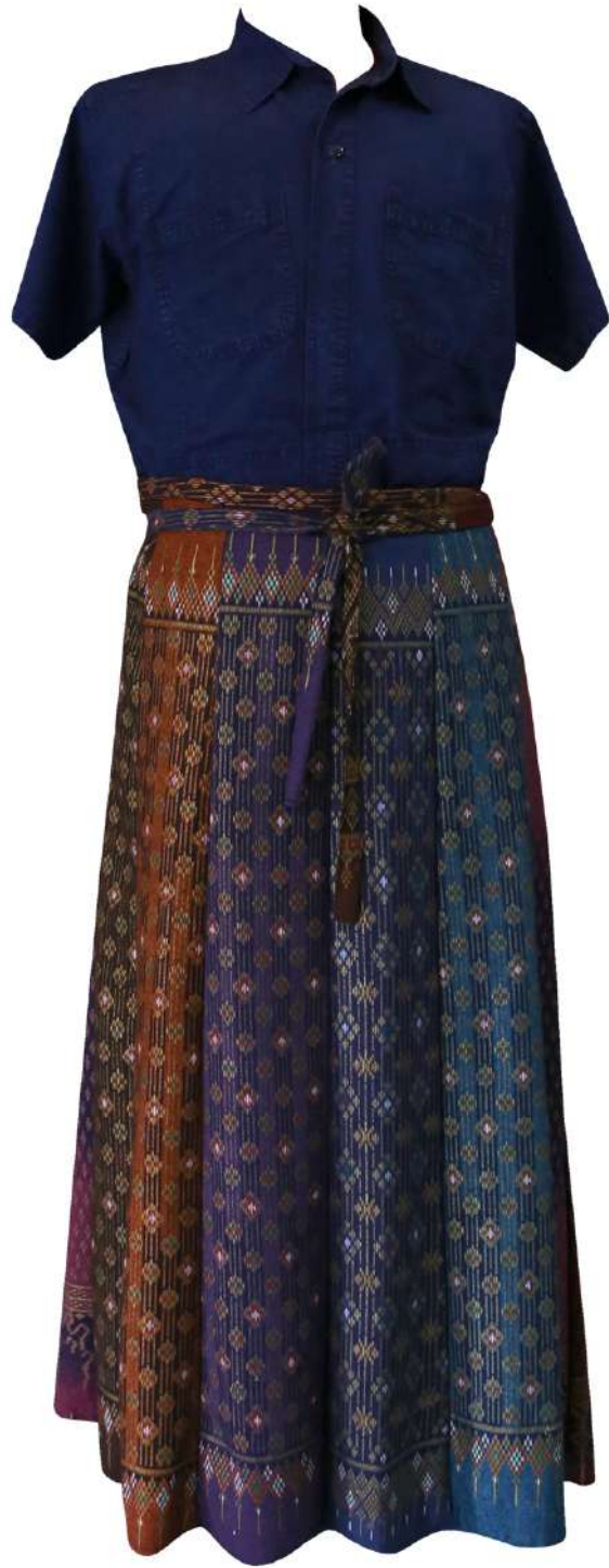
ชุดกระโปรงผ้าไหมมัดหมี่