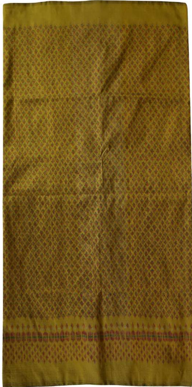
ผ้าไหมมัดหมี่ ลายสร้อยดอกหมาก