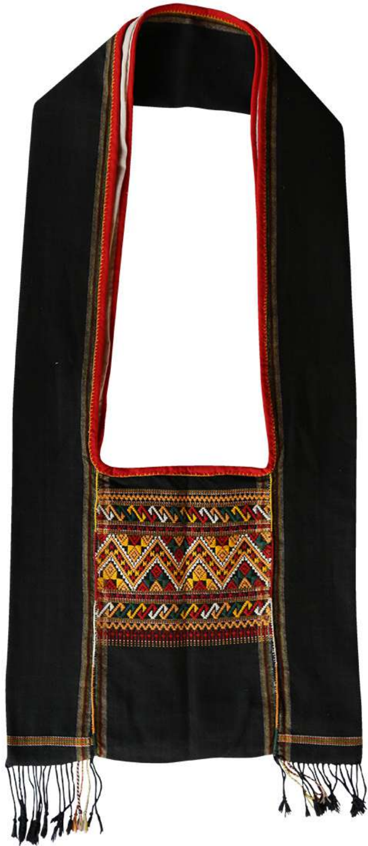
ถุงย่ามลาวครึ่ง