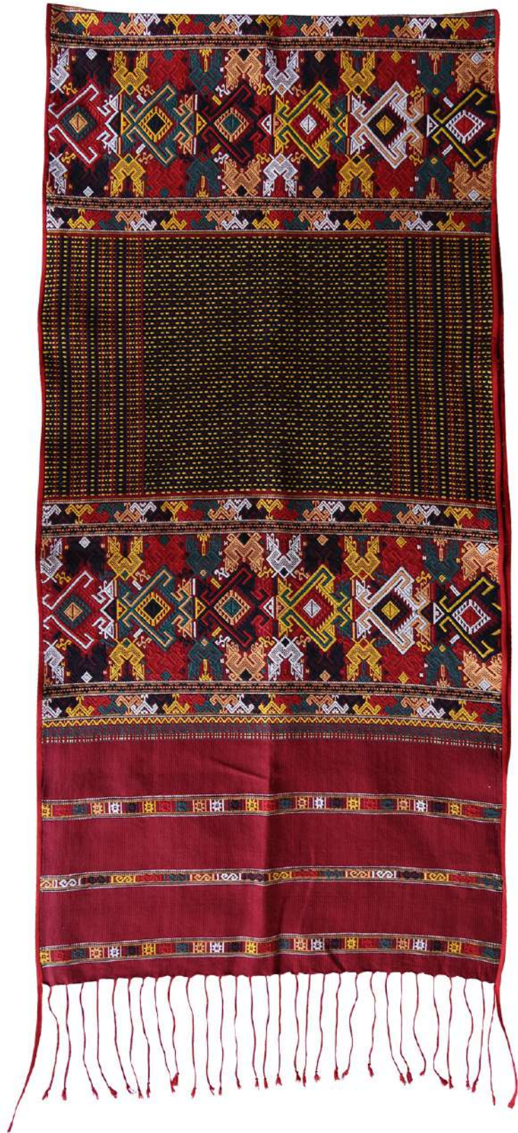
ผ้าคลุมไหล่ลาวครึ่ง