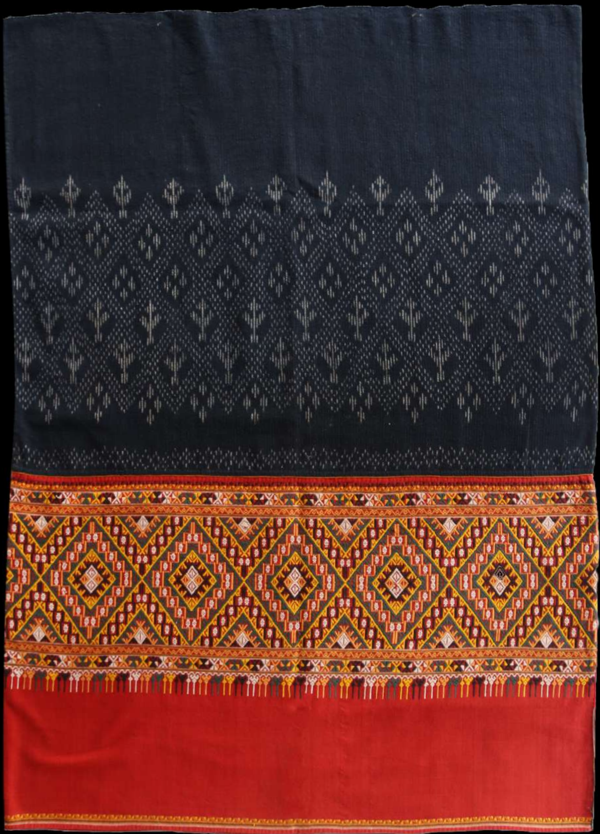
ผ้าซิ่นลาวครึ่ง