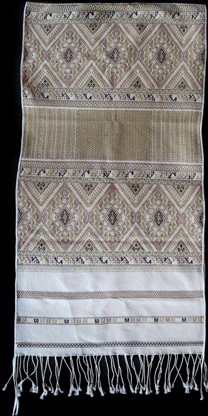
ผ้าคลุมไหล่ลาวครึ่ง