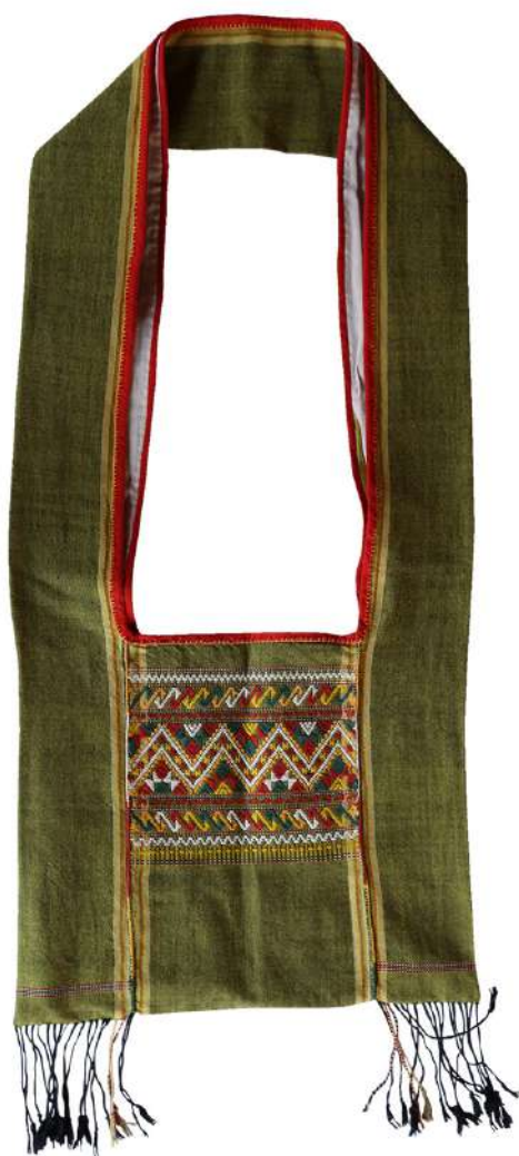
ถุงย่ามลาวครึ่ง