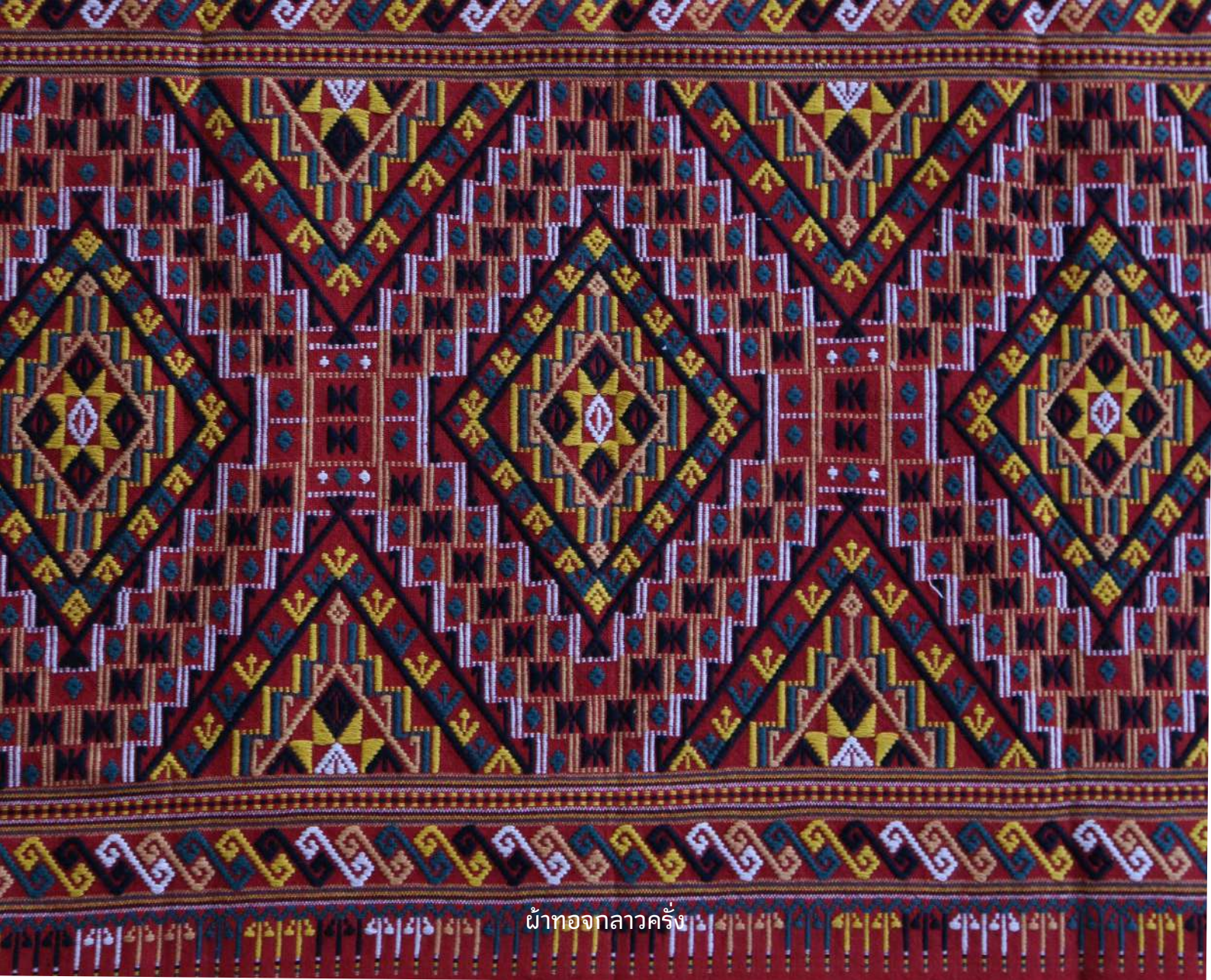
ผ้าทอลาวครั่ง