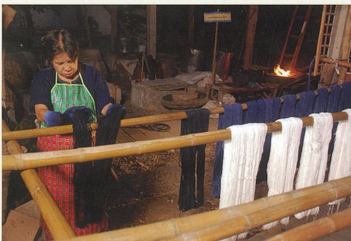
ครูประนอมชุบชีวิตการย้อมห้อมย้อมครามขึ้นมาใหม่