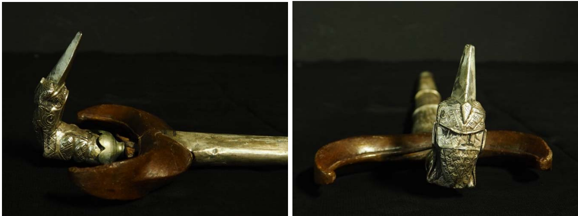
หัวกริชแบบสงขลาหรือแบบจะนะ

ด้ามกริชและหัวกริชนั้นมีความเกี่ยวโยงกันอย่างไม่สามารถแยกออกจากกันได้ หัวกริช มักจะทำจาก งานไม้ โลหะ งาช้าง และมีการแกะสลักลวดลายอย่างวิจิตรบรรจง เป็นสัญลักษณ์ที่สื่อถึงความหมายต่างๆ ด้วย หัวกริชแต่ละหัวนั้นจะมีโครงสร้างไม่เหมือนกัน โครงสร้างโดยรวมของหัวกริช แบ่งเป็น 3 ส่วนด้วยกัน คือ ส่วนหัว ส่วนลำตัว และส่วนจมูก ที่ถือเป็นองค์ประกอบของหัวกริช หัวกริชมีรูปแบบหลายสกุลช่าง แต่หัวกริช ที่เป็นที่นิยมในพื้นที่จังหวัดชายแดนภาคใต้จะนิยมอยู่ 2 รูปแบบ จาก 2 พื้นที่ ได้แก่ หัวกริชจะนะหรือสงขลา หัวกริชปัตตานีหรือหัวกริชพังงา (พังงาหรือนกพังงา เป็นนกชนิดหนึ่ง) ซึ่งหัวกริชทั้ง 2 รูปแบบนี้จะมี ความ แตกต่างกัน หัวกริชแบบสงขลาหรือแบบจะนะ ลักษณะปลายจมูกจะแหลมไม่ตัด นิยมลวดลายเป็นดอกลาย ปาลาเว ไม้ที่ใช้ทำหัวกริชส่วนใหญ่เป็นไม้ดอกแก้ว เนื่องจากเนื้อไม้มีความละเอียด คงทน และเป็นไม้มงคล แต่ก็อาจมีการใช้ไม้ชนิดอื่นมาแกะเป็นหัวกริชก็ได้แต่อาจไม่เป็นที่นิยมมากนัก ส่วนหัวกริชแบบปัตตานีหรือหัว กริชพังงา เอกลักษณ์ที่ชัดเจนคือจะมีเครา กริชตัวผู้หัวกริชลำตัวหนา ส่วนหัวกริชตัวเมียจะไม่มีเคราลำตัวจะ บาง