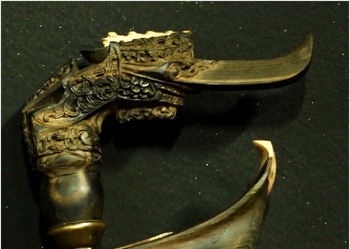
หัวกริชบอตอกาลอ