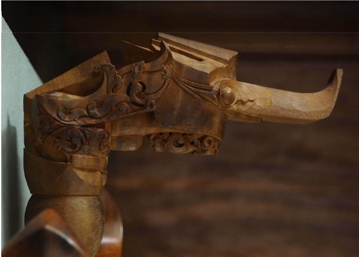
หัวกริชเตอร์

กริช จึงเป็นเอกลักษณ์เฉพาะของชาวมุสลิมชายแดนใต้ที่เป็นทั้งอาวุธและวัตถุมงคล ที่ใช้ปัจจุบันยังคงเป็นที่นิยม และยังมีนิยมใช้สะสมเป็นของเก่าที่มีคุณค่าและราคาสูงอีกด้วย