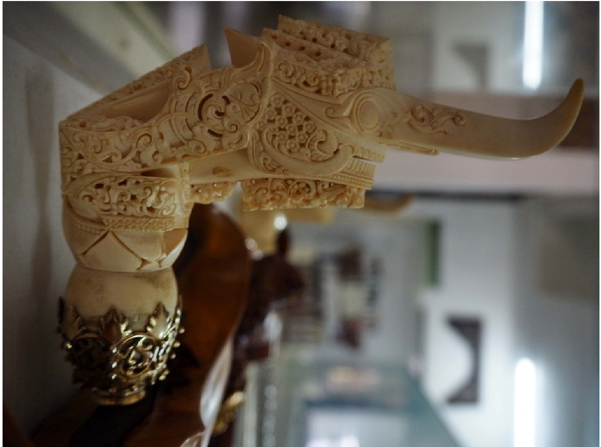
หัวกริชตามีองง