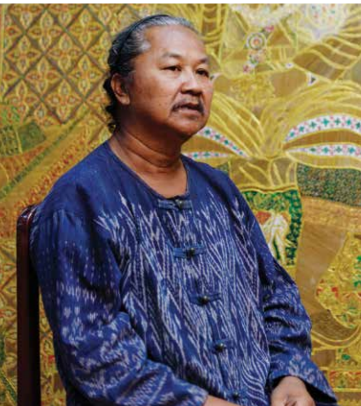
ครูศิลป์ของแผ่นดิน 2560

The art of Tang Bai Larn, or palm-leaf inscribing, is an ancient craftsmanship of Thailand. It is assumed to be originated during the Sukhothai Era, as there are many historical records made in palm-leaf inscription which had been passed on through times until today. After early days of Rattanakosin Era, the craftsmanship of palm-leaf inscribing has gradually disappeared from Thai society. In the past, palm-leaf inscription was used in important royal ceremony, or important event which was related to the monarch or high level nobility of Siam Royal Court. This was because, in the past, there was not good enough material for recording. The people hence inscribed important