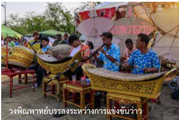
วงพิณพาทย์บรรเลงระหว่างการแข่งขันว่าว

นอกจากนี้ ด้วยสภาพภูมิอากาศของประเทศไทยที่เหมาะสมกับการเล่นว่าว ทั้งทำเลที่ตั้งของประเทศไทย ในช่วงเปลี่ยนผ่านระหว่างฤดูฝนเป็นฤดูหนาว จะมีลมที่พัดเอากความแห้งแล้งและหนาวเย็นจากภาคใต้ของจีนมาสู่บริเวณประเทศไทย เรียกว่า “ลมมรสุมตะวันออกเฉียงเหนือ” ซึ่งตรงกับเวลาเก็บเกี่ยวแล้วเสร็จ เป็นช่วงที่กระแสนลมดีและท้องทุ่งนากว้างขวางว่างเปล่า ลมที่พัดจากทิศเหนือลงใต้ชาวบ้านเรียก “ลมว่าว” ส่วนลมที่นิยมเล่นว่าวเป็นลมที่พัดจากทิศใต้ขึ้นเหนือในช่วงกลางฤดูร้อนเรียกว่า “ลมตะเภา” ชาวบ้านจะทำว่าวหลากหลายชนิดออกมาวัดกันเต็มท้องฟ้า หนุม ๆ จะเอาว่าวไปฝากสาว หรืออุดว่าวของตัวให้ลอยสูงเด่นเพื่อเรียกร้องความสนใจ บางครั้งก็อาศัยว่าวนี้เองชักขึ้นไปต่อสู้อากาศกับว่าวของหนุมบ้านอื่น เพราะแต่ละหมู่บ้านมีว่าวที่ผ่านฝีมือและทักษะความชำนาญ จึงจะโค่นว่าวตัวอื่น ๆ ลงได้