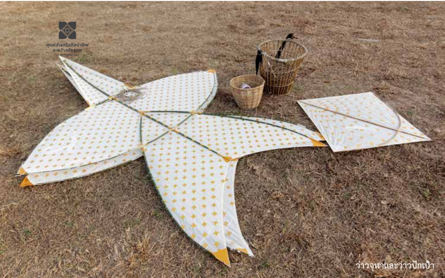
ว่าวจุฬาและว่าวปักเป้า

นอกจากนี้ ด้วยสภาพภูมิอากาศของประเทศไทยที่เหมาะสมกับการเล่นว่าว ทั้งทำเลที่ตั้งของประเทศไทย ในช่วงเปลี่ยนผ่านระหว่างฤดูฝนเป็นฤดูหนาว จะมีลมที่พัดเอากความแห้งแล้งและหนาวเย็นจากภาคใต้ของจีนมาสู่บริเวณประเทศไทย เรียกว่า “ลมมรสุมตะวันออกเฉียงเหนือ” ซึ่งตรงกับเวลาเก็บเกี่ยวแล้วเสร็จ เป็นช่วงที่กระแสนลมดีและท้องทุ่งนากว้างขวางว่างเปล่า ลมที่พัดจากทิศเหนือลงใต้ชาวบ้านเรียก “ลมว่าว” ส่วนลมที่นิยมเล่นว่าวเป็นลมที่พัดจากทิศใต้ขึ้นเหนือในช่วงกลางฤดูร้อนเรียกว่า “ลมตะเภา” ชาวบ้านจะทำว่าวหลากหลายชนิดออกมาวัดกันเต็มท้องฟ้า หนุม ๆ จะเอาว่าวไปฝากสาว หรืออุดว่าวของตัวให้ลอยสูงเด่นเพื่อเรียกร้องความสนใจ บางครั้งก็อาศัยว่าวนี้เองชักขึ้นไปต่อสู้อากาศกับว่าวของหนุมบ้านอื่น เพราะแต่ละหมู่บ้านมีว่าวที่ผ่านฝีมือและทักษะความชำนาญ จึงจะโค่นว่าวตัวอื่น ๆ ลงได้