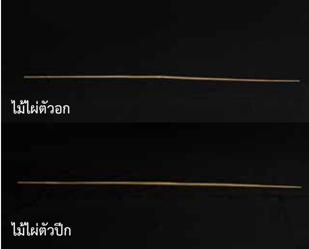
ไม้ไฟตัวอก