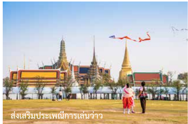
ส่งเสริมประเพณีการเล่นว้าว

ปัจจุบันการแข่งขันว้าวยังมีให้เห็นบ้าง เช่น ว้าว ประเภทสวยงาม ว้าวประเภทความคิด ว้าวประเภทความสูง หรือแม้แต่การแข่งขัน “ว้าวจุฬา-ปีกเป้า” ก็ยังเป็นการแข่งที่ ได้รับความนิยม โดยกติกาในการแข่งขันก็ยังสืบทอดมาจาก สมัยโบราณ คือแบ่งเป็น 2 ฝ่าย ฝ่ายว้าวจุฬาจะอยู่เหนือลม ว้าวปีกเป้าอยู่ใต้ลม ถ้าฝ่ายใดทำให้ว้าวของอีกฝ่ายลอยมา ตกลงในแดนของตนได้ ก็นับเป็นฝ่ายชนะการแข่งขัน