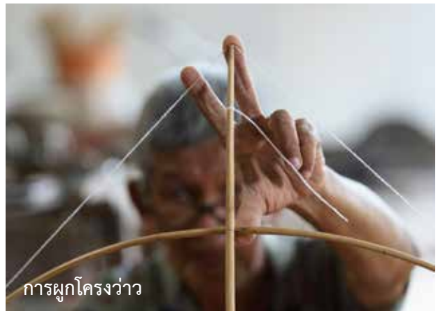
การผูกโครงว่าว