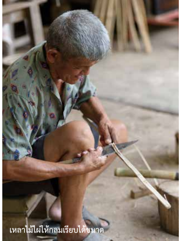
เลลลาคไม้ไฟให้กลมเรียบได้ขนาด

ตรวจสอบโครงว่าวโดยใช้ด้ายผูกเป็นสายชุงชั่วคราว ลองห้อยโครงว่าวเพื่อตรวจสอบดูว่าเอียงไปทางด้านใด ให้ขยับ ด้ายในล่อนปลายปีกเข้าหรือออกให้เท่ากันทั้งสองข้าง และ ควรตรวจสอบการรับแรงลมของปีกโดยใช้วัสดุที่มีน้ำหนัก ทับที่ไม้อกด้านหลังว่าว ใช้เชือกผูกที่ปลายปีกทั้งสองข้างแบ่ง ระยะให้เท่ากันแล้วดึงให้ปลายปีกลอยจากพื้นประมาณหนึ่งคืบ โดยให้ไม้อกยังติดอยู่กับพื้น แล้วใช้ไม้บรรทัดหรือตลับเมตร วัดจากพื้นถึงปลายปีก ถ้าข้างใดกระยะน้อยกว่าแสดงว่าปีกข้าง นั้นแข็ง ต้องขุดให้ได้ระยะเท่า ๆ กัน