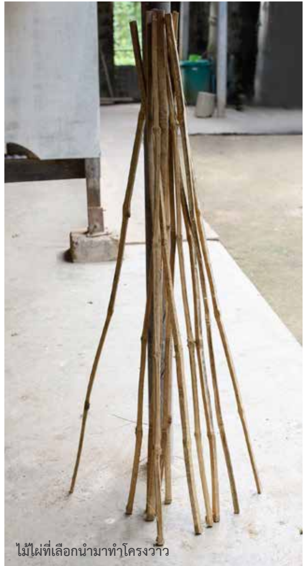
ไม้ไผ่ที่เลือกนำมาทำโครงว้าว

การตัด และการเหลาไม้ไผ่ ต้องใช้ทักษะในการเล่น เพื่อให้ได้ไม้กลมเรียบได้ขนาด และต้องเหลาลบข้อออกเพื่อให้ไม้กลมเรียบรูตได้ไม่มีเสี้ยน ใช้ไม้หน้าสามบากทำเป็นตะขอตัดให้ไม้ตรงด้วยการใช้ไฟลนให้ไม้ไผ่อ่อนตัวก่อนแล้วตัด อาจมีการใช้น้ำประคบเพื่อไม่ให้คันทัว