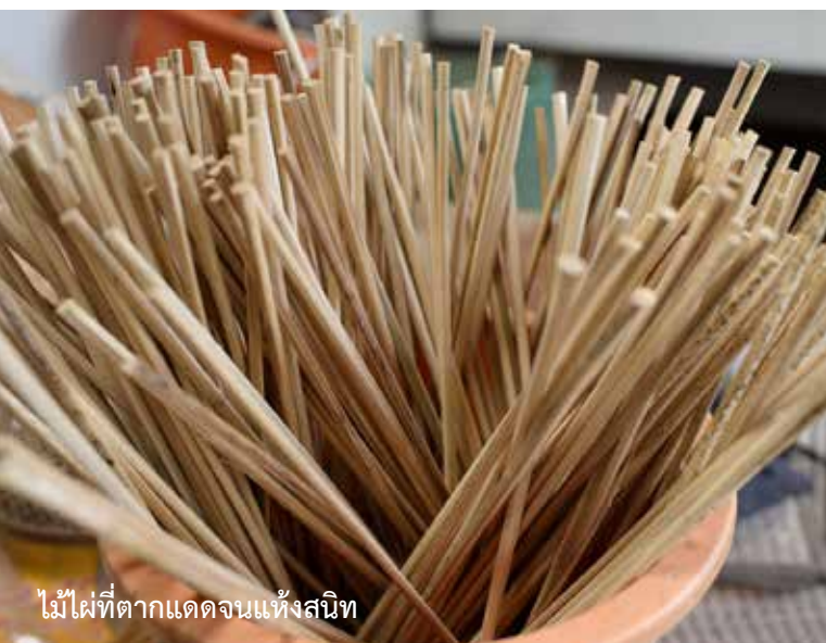
ไม้ไผ่ที่ตากแดดจนแห้งสนิท