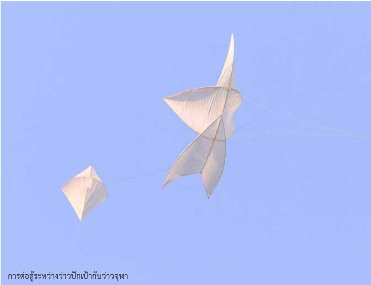
การต่อสู้ระหว่างว้าวปีกเป้ากับว้าวจุฬา

“ว้าว” จึงถือเป็น วิถีชีวิตหนึ่งของคนไทยที่เห็นกัน อย่างคุ้นเคยในทุกภาคทั่วประเทศ การทำว้าว ถือว่าเป็นทั้งศาสตร์ และศิลป์ของช่างผู้ทำว้าวที่ต้องมีทั้งความรู้ ประสบการณ์ และทักษะฝีมือ ตั้งแต่ต้องรู้จักคัดเลือกสรรหาวัสดุอุปกรณ์ที่ เหมาะสมในการทำ เช่น ไม้ต้องตรง มีน้ำหนักเบา มีความ เหนียวทนทาน วัสดุประกอบอื่น ๆ เช่น กระดาษพลาสติก ผ้า และเชือก หรือด้าย ต้องใช้ให้เหมาะสม การทำอุปกรณ์ต่าง ๆ ต้องละเอียดประณีตมีเทคนิคเฉพาะตัว สัดส่วนของโครงว้าว แต่ละชนิดมีรูปแบบเฉพาะ ต้องมีทักษะในการทำ การเล่น รู้จักภาวะของสภาพพื้นที่ภูมิอากาศและกาลเวลา