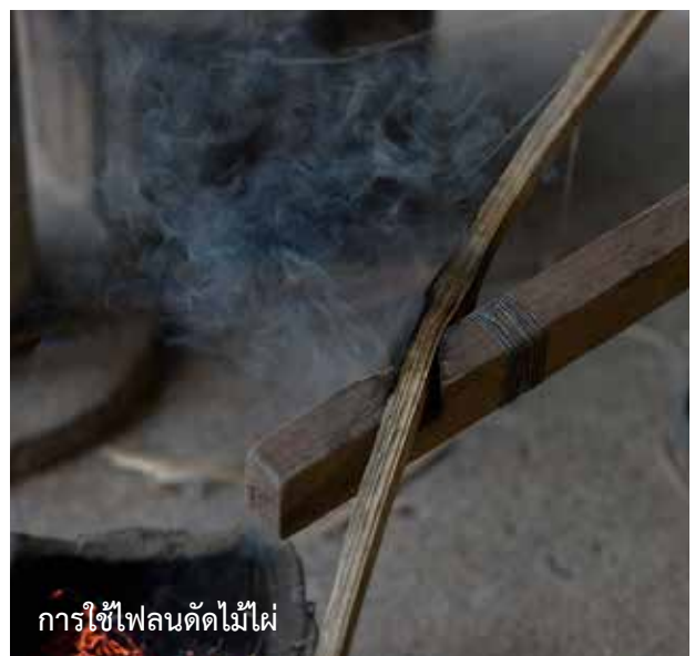
การใช้ไฟลนตัดไม้ไผ่