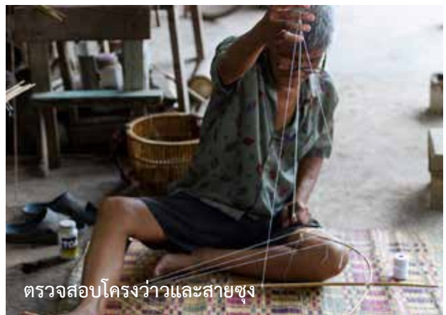
ตรวจสอบโครงว่าวและสายชุง