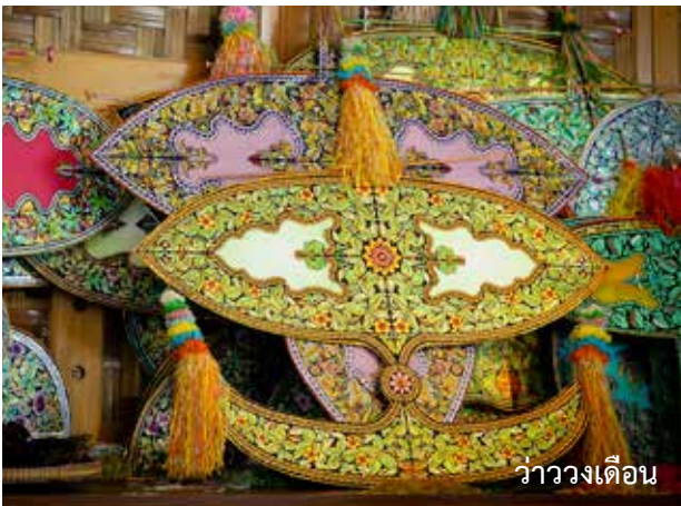
ว่าววงเดือน