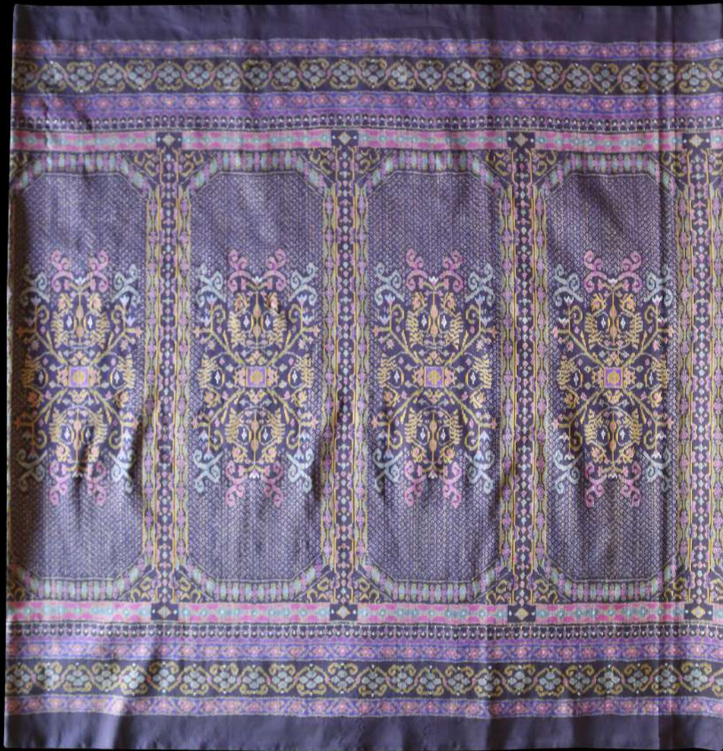
ผ้าไหมมัดหมี่