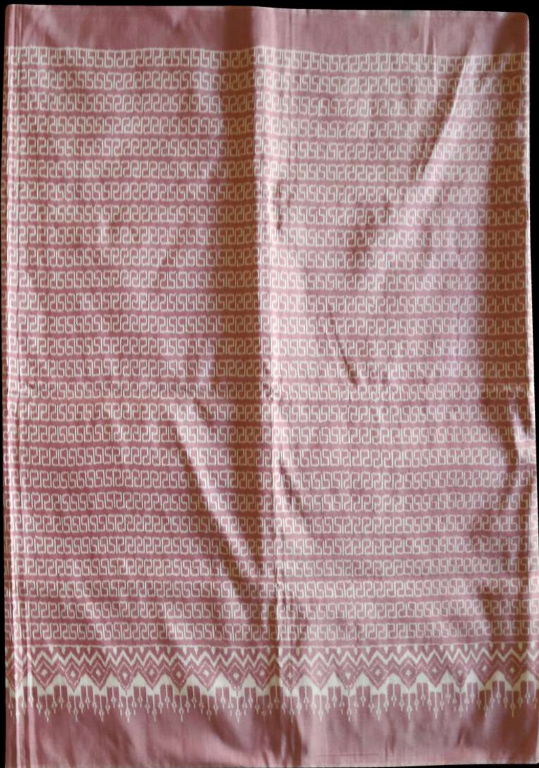
ผ้าไหมมัดหมี่