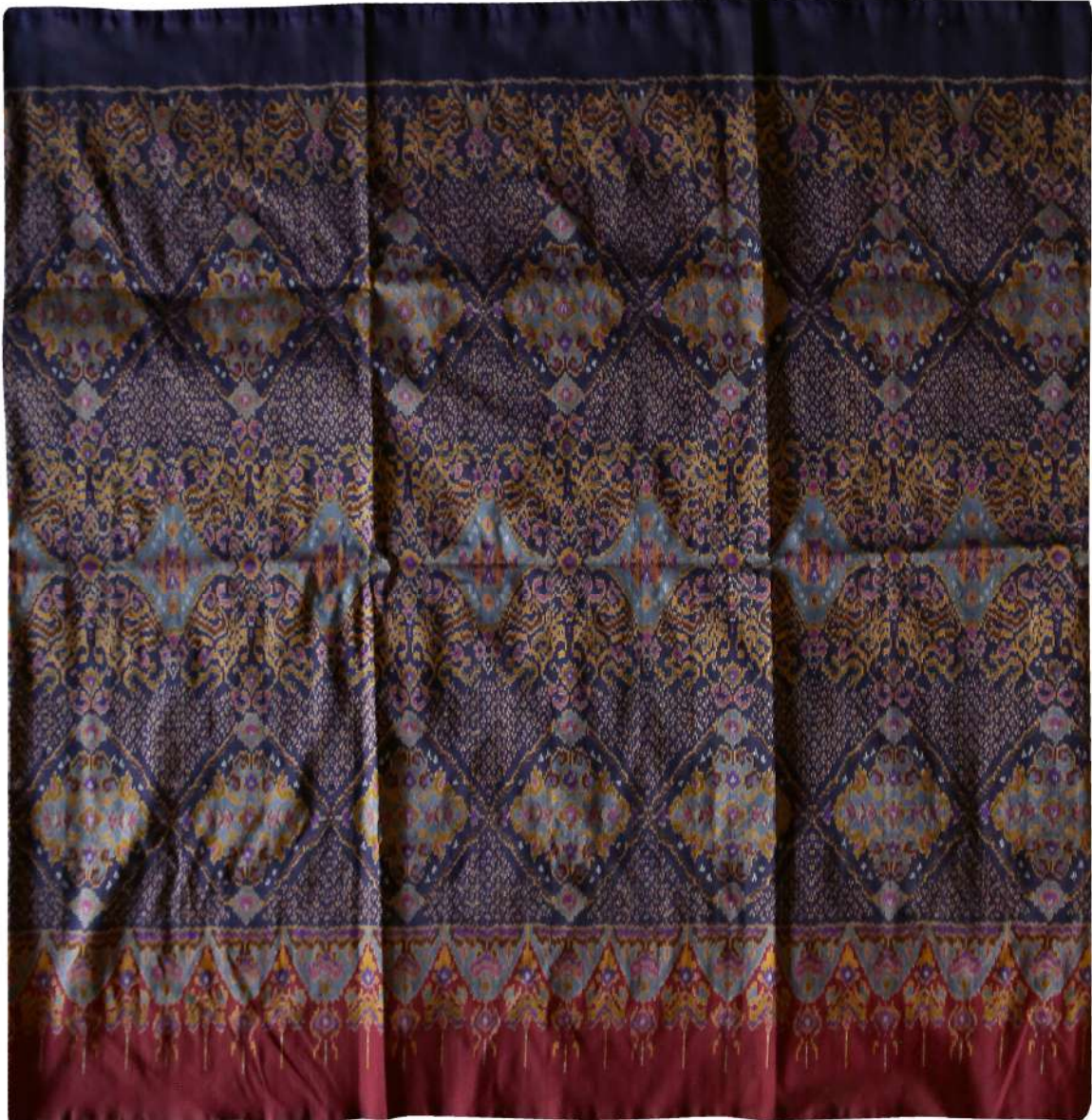
ผ้าไหมมัดหมี่