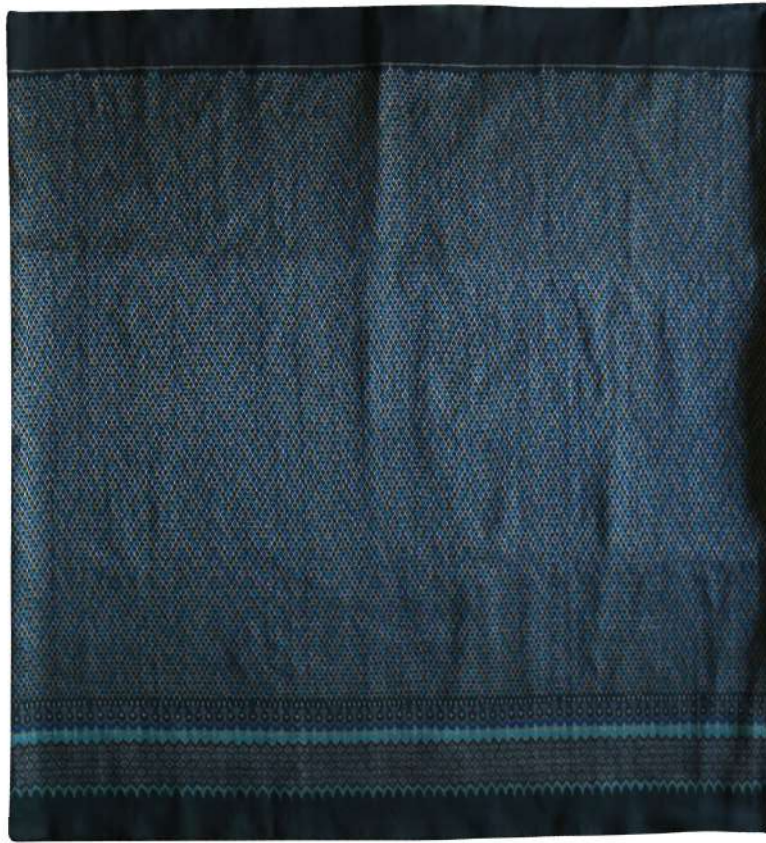
ผ้าไหมมัดหมี่