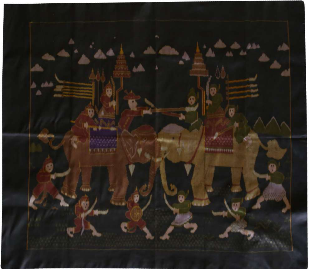
ผ้าไหมมัดหมี่