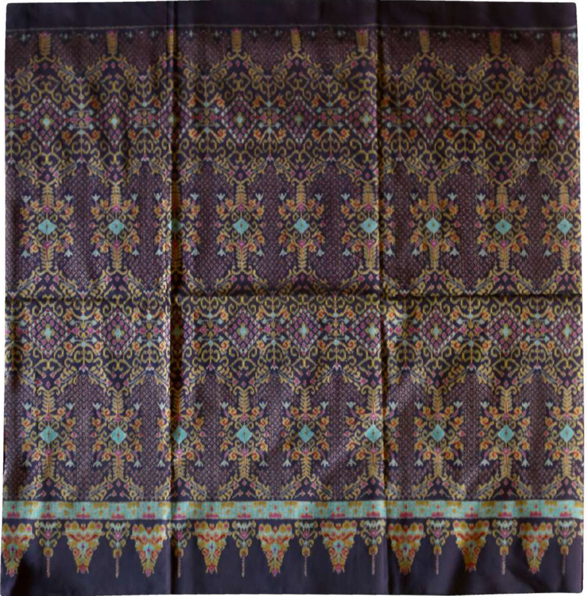
ผ้าไหมมัดหมี่