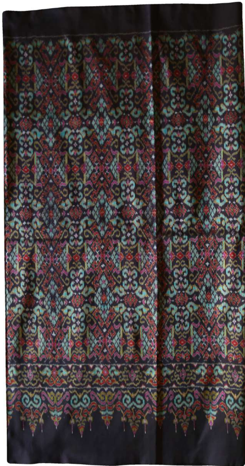
ผ้าไหมมัดหมี่