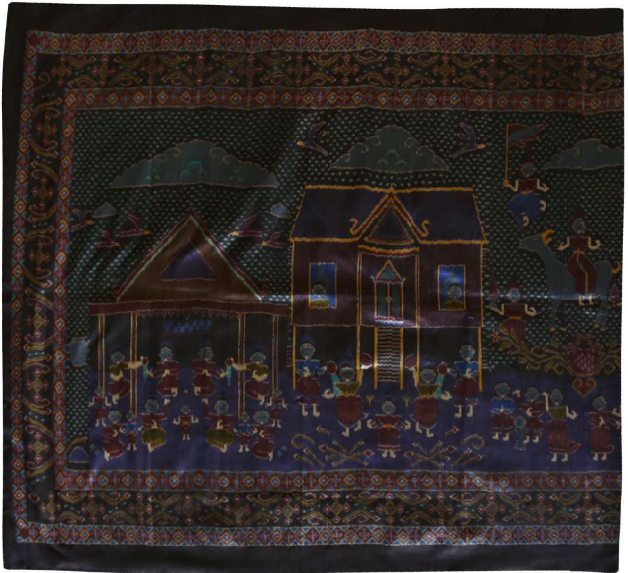
ผ้าไหมมัดหมี่