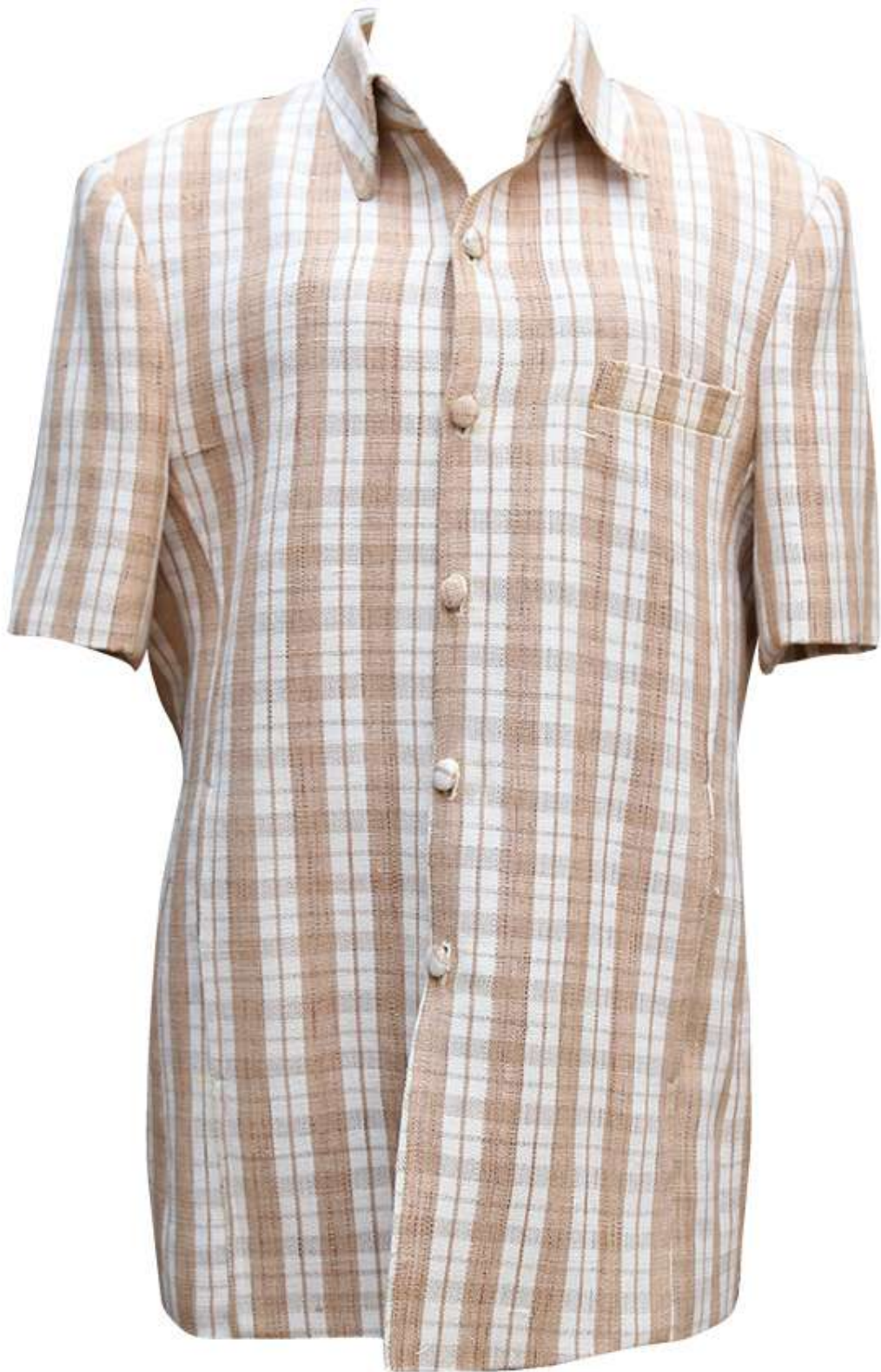
เสื้อผ้าฝ้ายย้อมสีธรรมชาติ