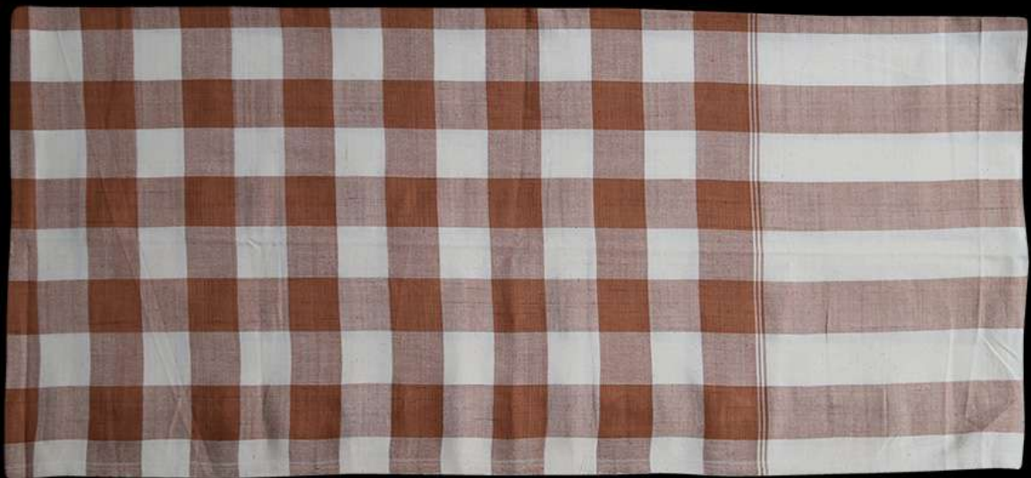
ผ้าฝ้ายย้อมสีธรรมชาติ