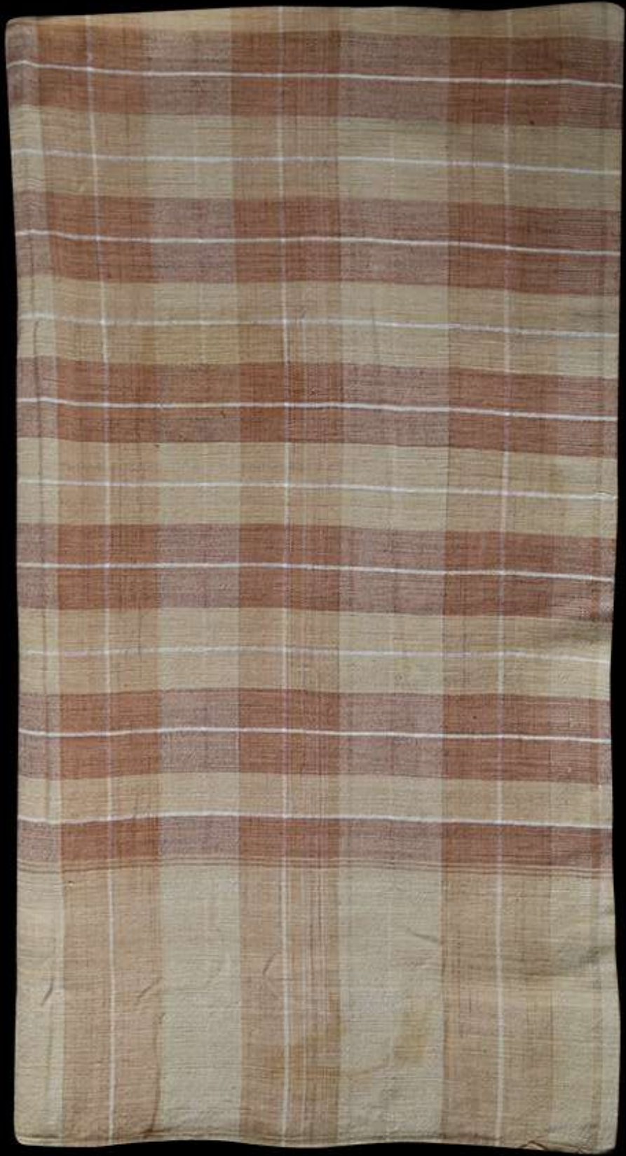
ผ้าฝ้ายข้อมสี่ธรรมชาติ