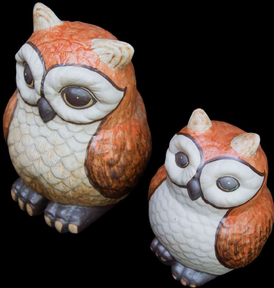
เซรามิก รูปนกฮูก