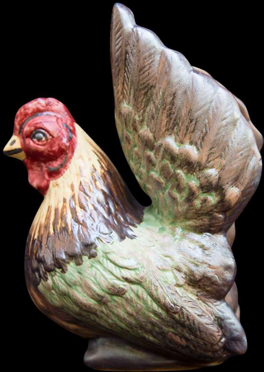
เซรามิก รูปไก่