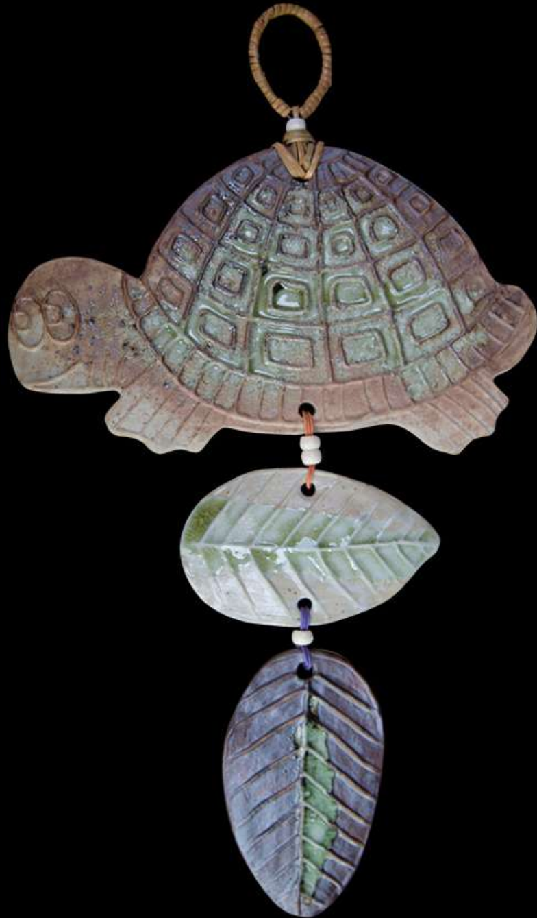
เซรามิก รูปเต่า