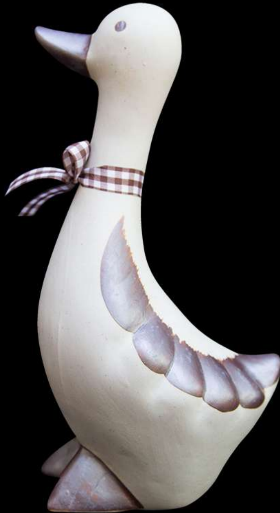
เซรามิก รูปเป็ด