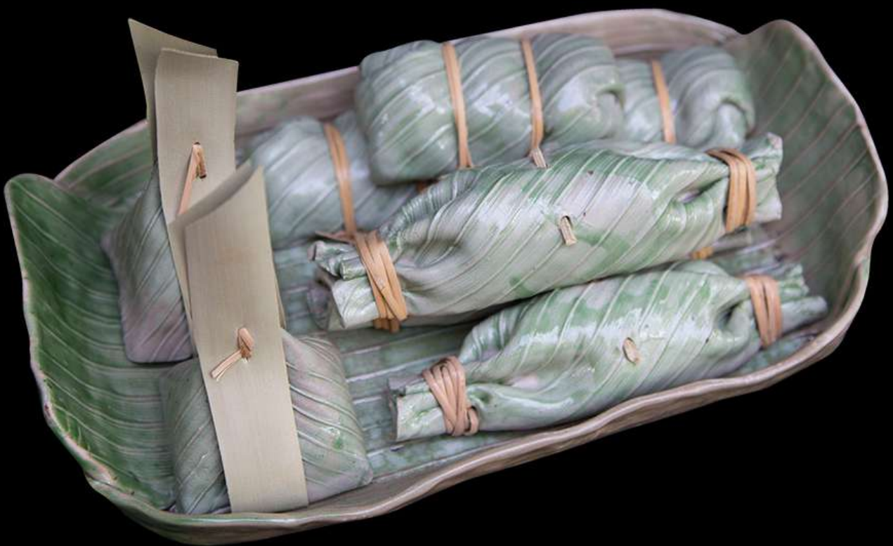
เซรามิก รูปข้าวต้มมัด