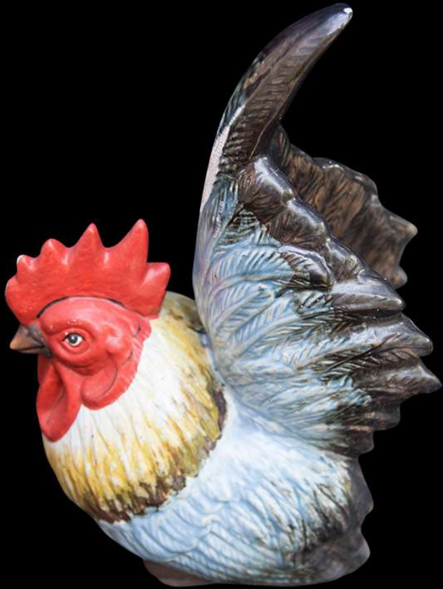
เซรามิก รูปไก่