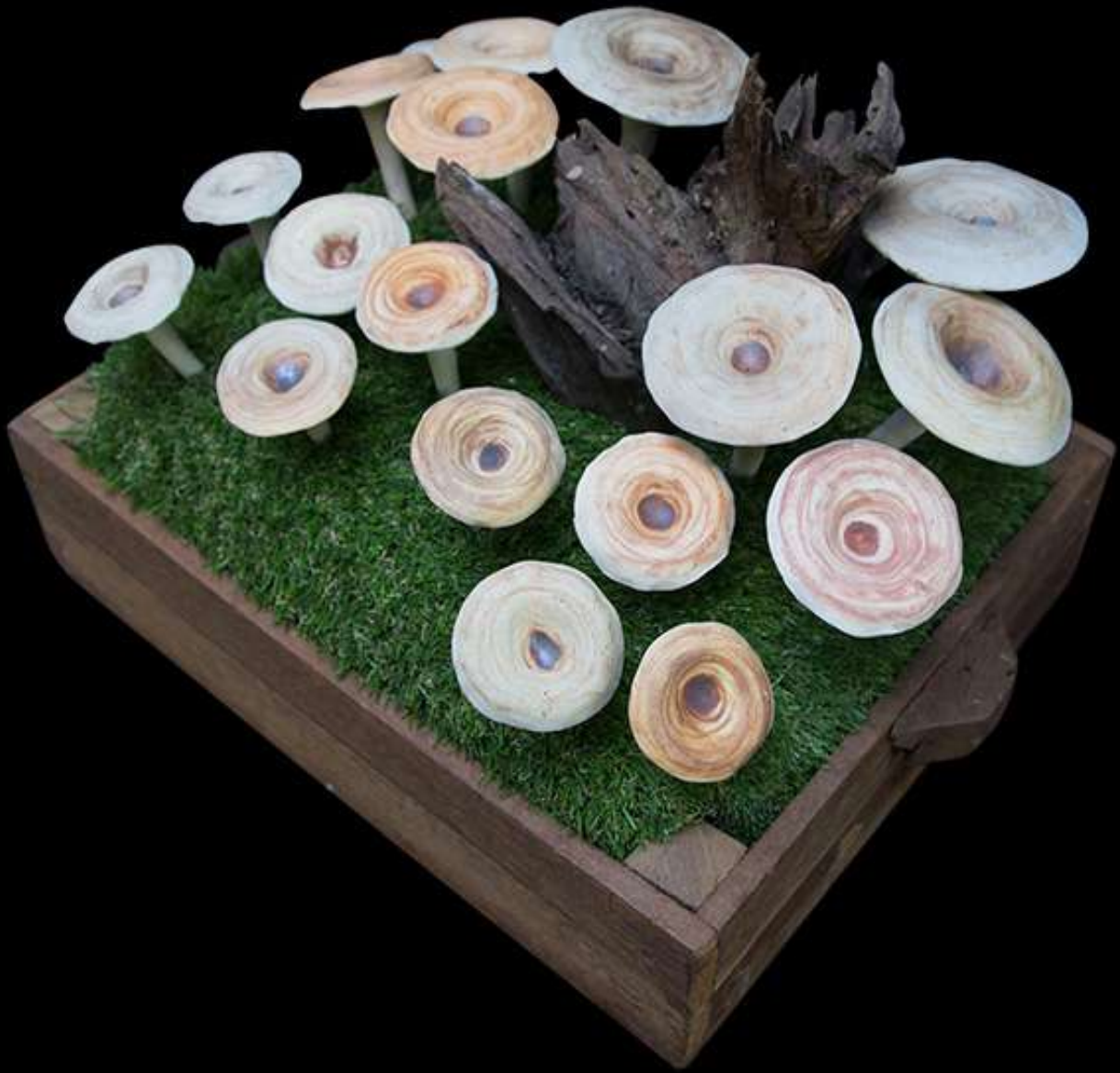
เซรามิก รูปเห็ด