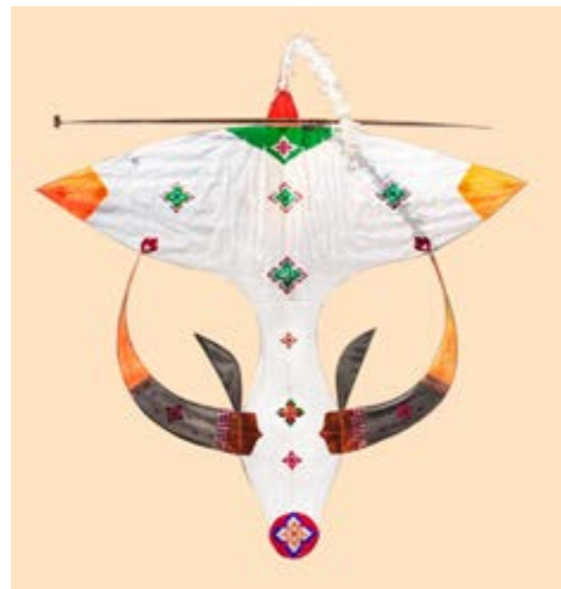
ว่าวควาย