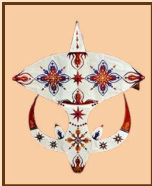
ว่าวควาย