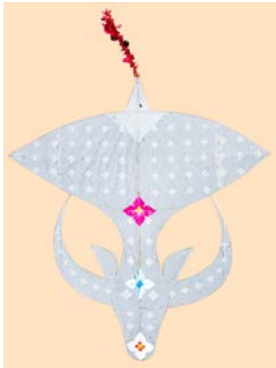
ว่าวควาย