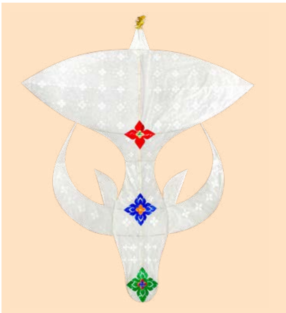
ว่าวควาย

ว่าวควาย เป็นว่าวไทยที่ถือได้ว่าเป็นเอกลักษณ์ของจังหวัดสตูล เกิดจากการผสมผสานระหว่าง ว่าวจุฬา กับว่าววงเดือน นำมาปรับเปลี่ยนรูปแบบให้มีลักษณะที่มีความโดดเด่นคล้ายควาย กลายเป็นที่สะดุดตาของผู้พบเห็น ที่มาของ “ว่าวควาย” เกิดจากช่างทำว่าวมีแนวคิดจะตอบแทนบุญคุณของควายที่ช่วยทำไร่ไถนา จึงได้สร้างสรรค์ว่าวให้มีรูปร่างลักษณะคล้ายควาย ถือเป็นว่าวที่มีความสมบูรณ์แบบตามโครงสร้างการทำว่าวที่ดีเพราะมีองค์ประกอบครบถ้วน คือ มีหัว มีหู มีจมูก มีเขาและมีการสร้างสรรค์ลวดลายที่วิจิตร สวยงาม